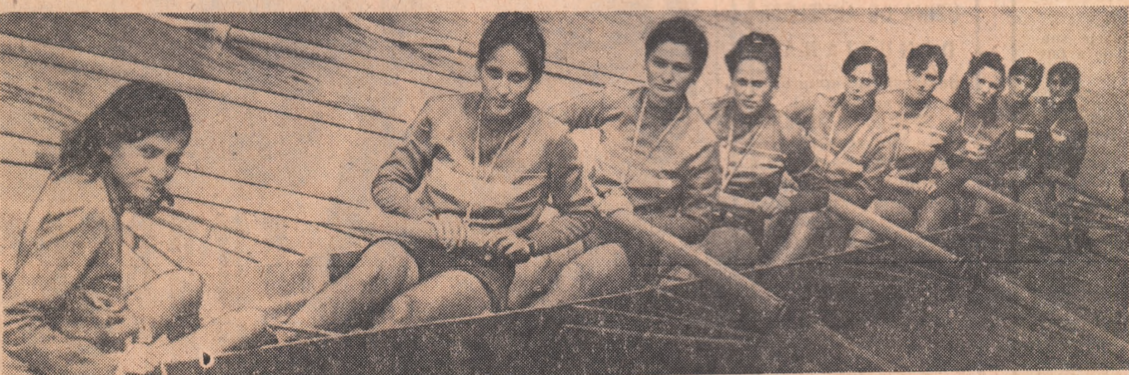
Lupa trei zile de entuziaste întreceri tinerești, au fost stabiliți campioni de juniori la canotaj. Iată un cîrpeți din multe momente de satisfacție ale finalilor: la podiumul de premiere — echipajul de junioare mari al Școlii sportive nr. 1 București, invingător în spectaculoasa probă de 8+1. Rezultatele principale ale acestei competiții — în pag. a 11-a a ziarului.