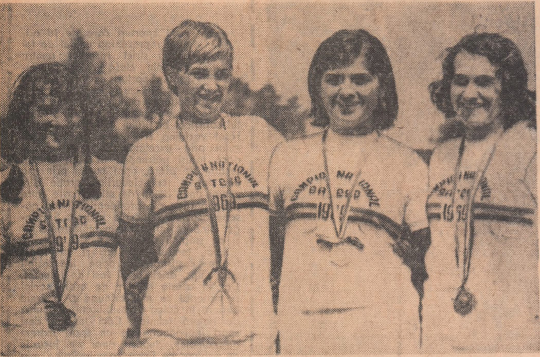
Fetele din Maramures au fost la inaltime. Iata-le zimbind fericite dupa castigarea stafetei de 4x100 m (junioare).