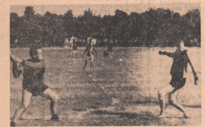
O reușită acțiune la bătaia în timp, din meciul de oină Voința Câmpiniș (jud. Gorj) - Victoria Cristești (jud. Hîrlău).