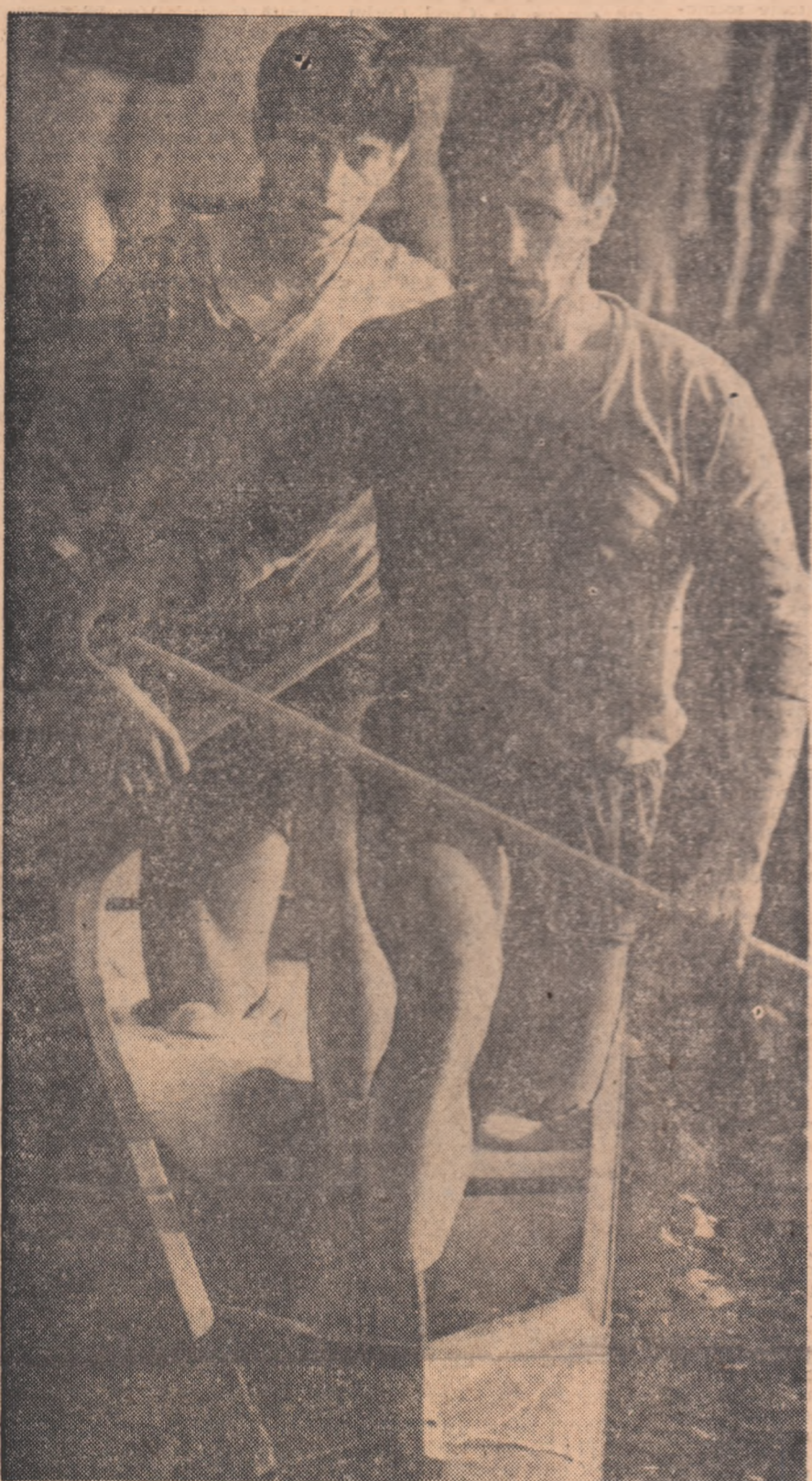
Campionii olimpici Ivan Patzaichin și Serghei Covaliov și-au onorat, sîrîște, titlul suprem la canoe dublu, cucerind pe pista de apă de pe Himki, medalia de aur la C.E. (Citîți în pag. a 4-a cronică trimisului nostru special la Moscova, Dan Gârleşteanu).