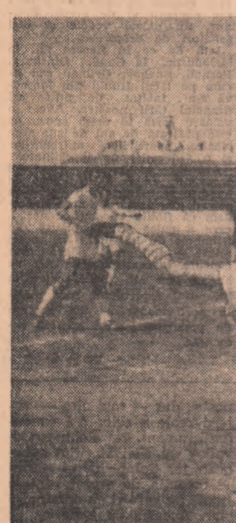
Centrea lui Iancu (Metalul București) este fructificată de... portarul brăilean, care a deviat balonul în plasă. Este al treilea gol al metalurgiștilor. (Fază din meciul Metalul București-Progresul Brăila 4-2).

GALAȚI, 17 (prin telefon). Studenții au debutat în noul campionat cu o victorie, în fața unui adversar care a ple-cat steagul destul de greu. În ciuda căldurii caniculare, ambele echipe au făcut o ade-