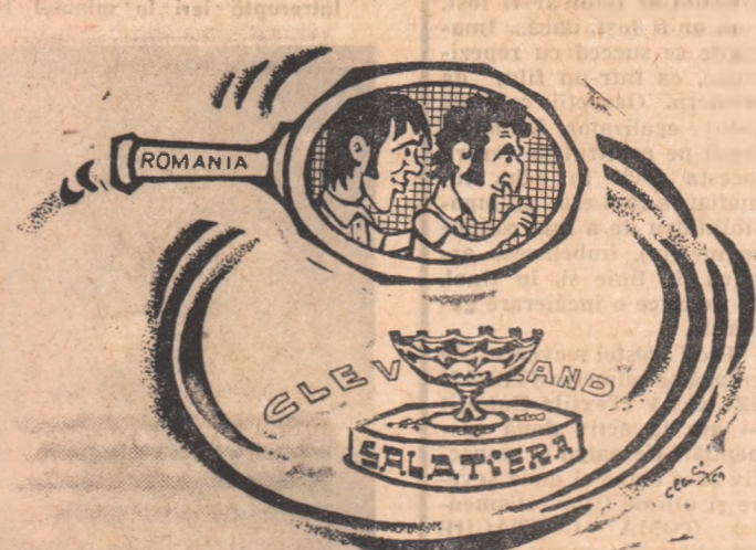
Racheta tenismanilor români pleacă pe căi argintate spre Salatiere (la 21 septembrie — a. salătierea)

„Iată citeva din titlurile sub care presa americană a publicat, în aceste zile, comentariile pe marginea dramaticului meci de tenis Anglia-România și pronosticurile asupra așteptatelor finale, în care echipa S.U.A. va avea ca adversară reprezentativa română. Comentariile cotidienele americane pe marginea spectaculosului meci de la Wimbledon abundă în superlative. „Tiriac, scrie influentul WASHINGTON POST, acționează cu multă inteligență, schimbînd continuu timpul jocului, folosindu-și loviturile cu multă atenție. În Europa, el este considerat ca un eminent jucător”. Despre Năstase, ziarul arată că „este foarte agil și se mișcă pe tot terenul cu argintul viu. Loviturile sale din volé sînt nimicitoare!”. La rîndul său, NEW YORK TIMES scrie despre „spectaculoasele mingi ale lui Năstase” și „periculoasele lovituri” prin surîndere expediate pe colțuri de către Tiriac.”