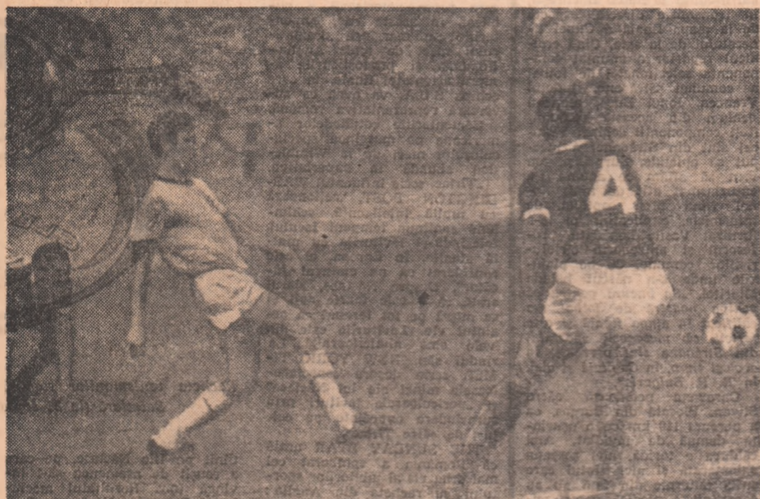
A început meciul, dar a început și ploia! Fază din jocul Dinamo - Palmeiras.

Interuptă ieri în minutul 14 se joacă azi, tot pe stadionul Dinamo, începând de la ora 16.30.