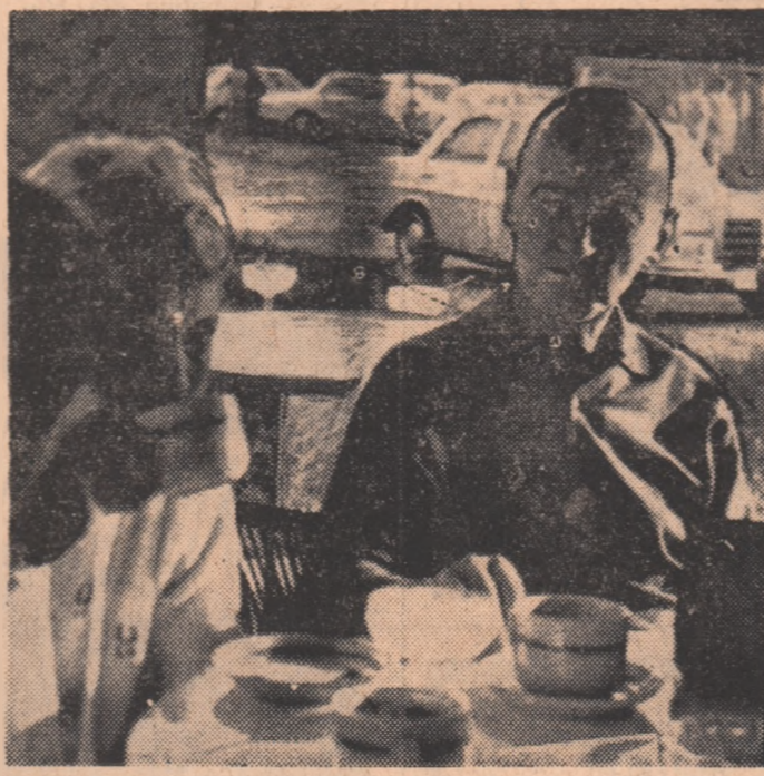
O fotografie din albumul turneului internațional de tenis de la Mamaia, 1968: Harry Hopman, la o cafea, pe terasa de la „Modern”.