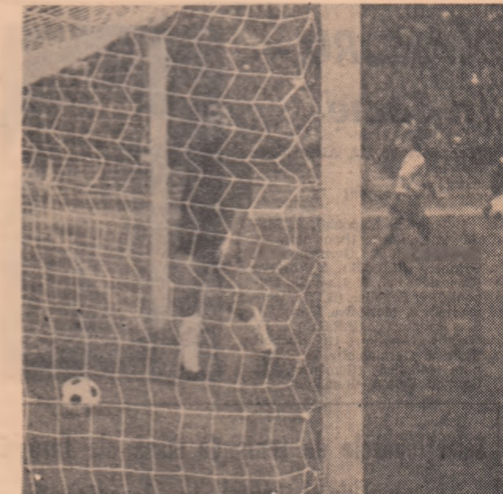
Neagu, debutant în lotul național, înscrie al 3-lea gol al echipei sale în meciul cu Steagul roșu