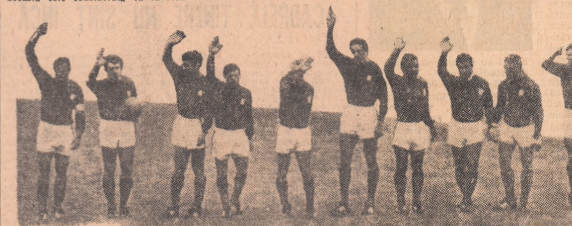
Fotbaliștii Portugaliei, fotografiați după memorabilul lor meci cu echipa R.P.D. Coreene, din sfîrșitul de finală ale ultimului C. M. (5-3).