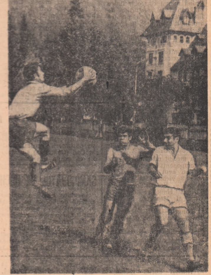
O fază spectaculoasă din meciul de la Sinaia, dintre Carpați și Prahova Ploiești (3-1)