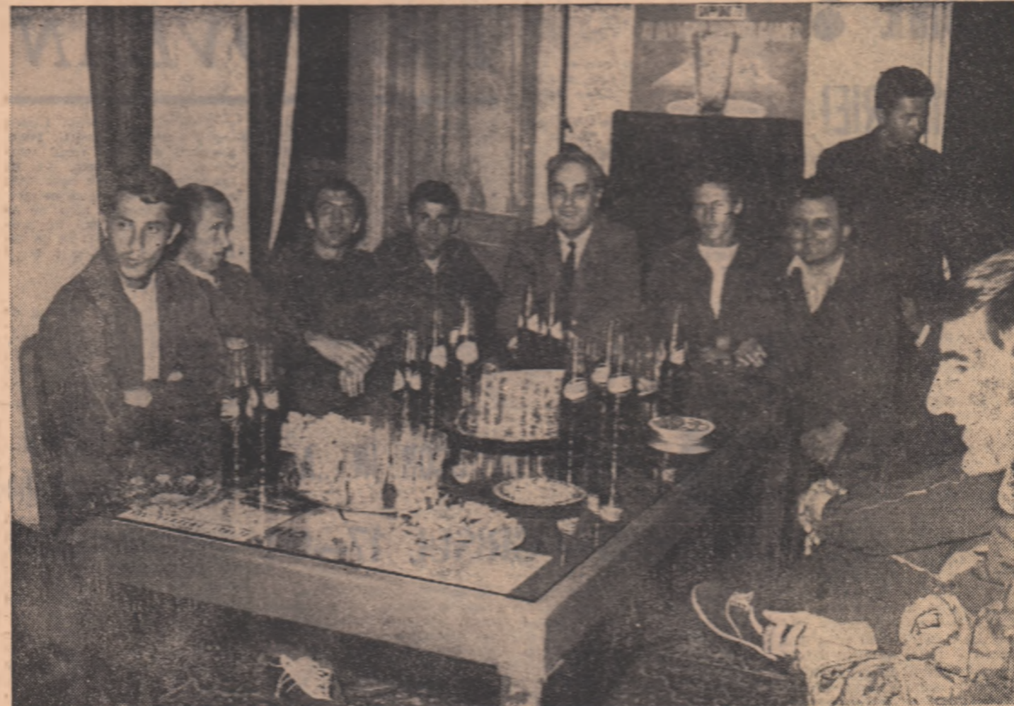
Primele clipe ale vizitei pe care ne-au făcut-o ieri fotbalistii. Se spun glume, se încearcă reproșuri — timide — aproape de noile din cronici, și, apoi, se discută, bineînțeles, despre meciul cu Portugalia...