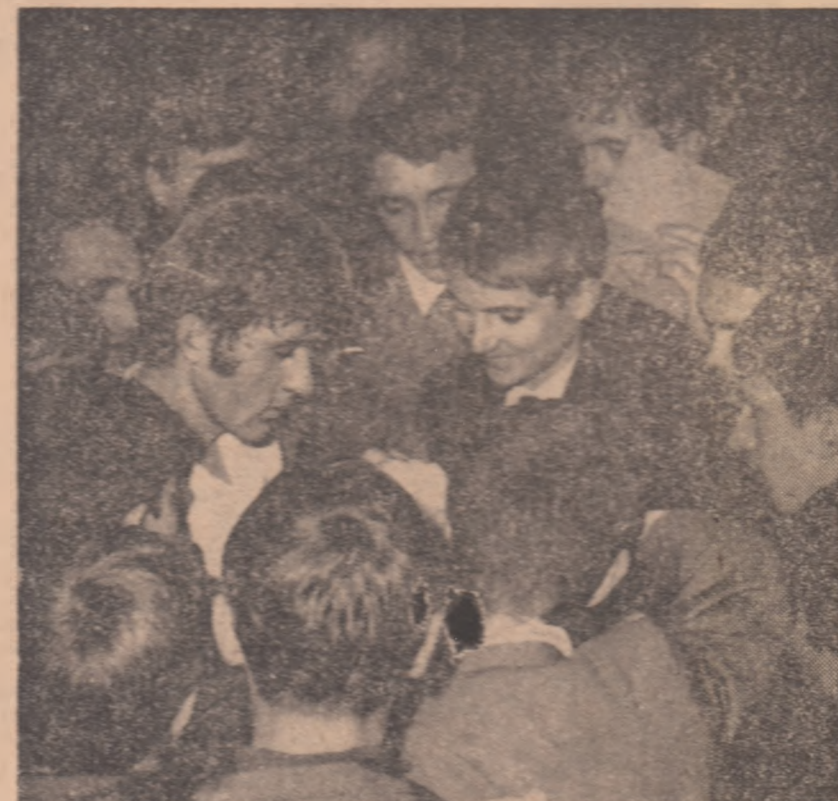
Ilie Năstase, câștigătorul „Cupei fair-play” oferită de ziarul nostru, lăsat cu asalt de entuziaștii săi admiratori, care i-au solicitat ieri zece de autografe

Tehnicienii ai federației de specialitate și-au oferit binevoitori concursul, astfel ca gala să poată beneficia de cele mai bune condițiuni de desfășurare. Încă din primele momente ne-a fost clar că succesul va fi și el prezent acolo. Semnalul a fost dat de apariția celor patru jucători, subliniată cu prelungi