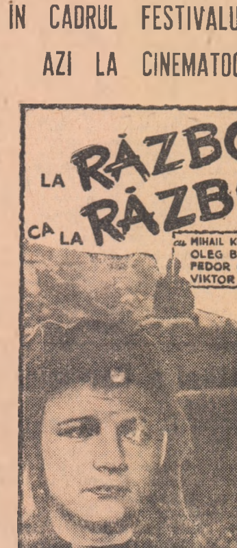
actorul VIKTOR TREGUBOVICI