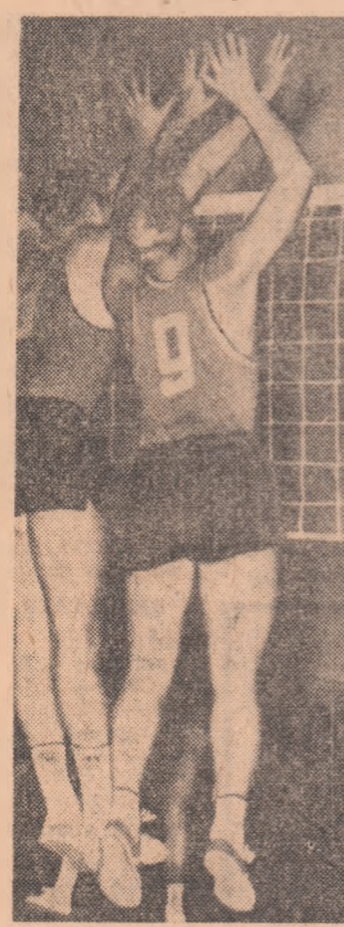
Duel deasupra fileului intre echipele Steaua si Unirea Tricolor (Braila)