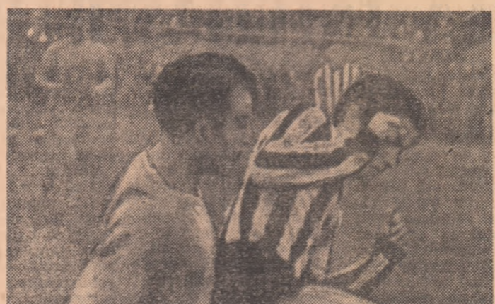
Savu (Sportul studentesc) a trecut de un adversar... Duelul Progresul Bucuresti - Metalul Bucuresti...