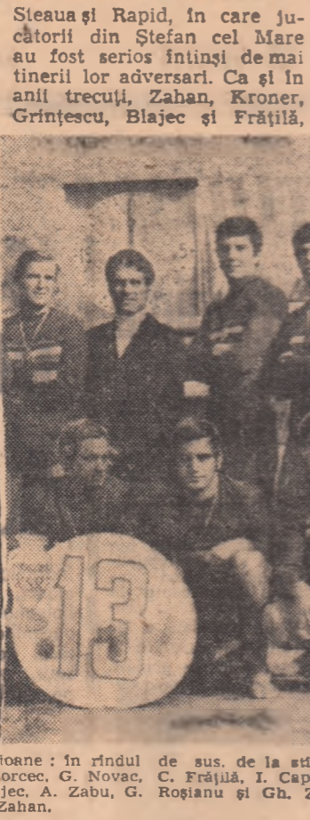
Noua formulă a echipei campioane în rândul de sus...

S-a încheiat un nou campionat de polo, al XXII-lea, care nu s-a deosebit prea mult de cele precedente.