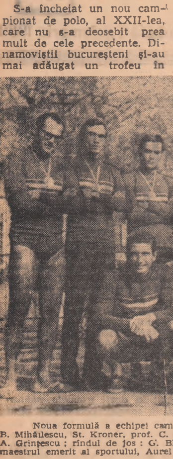
Noua formulă a echipei campioane în rândul de sus...