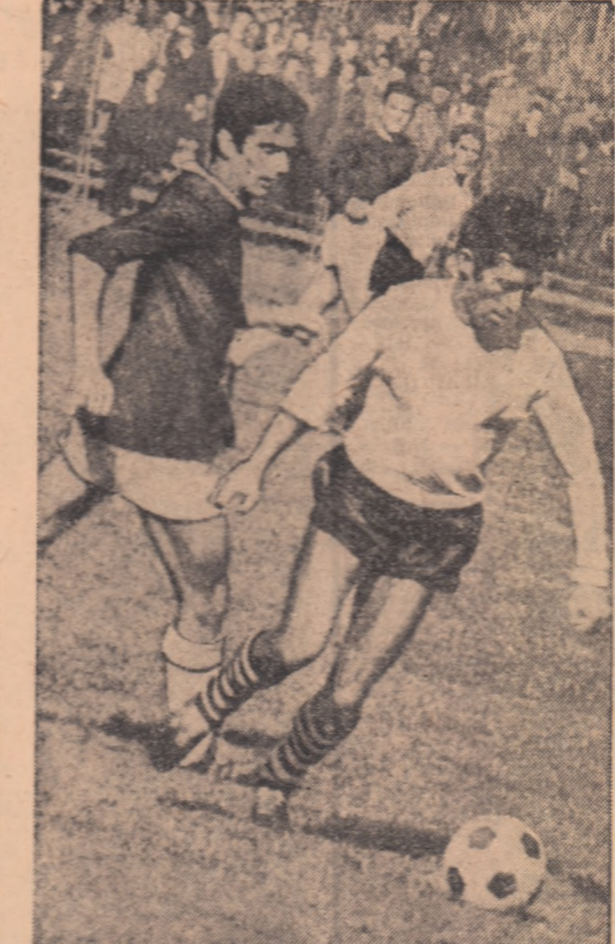
Matei nu mai poate interveni și apărătorul Flacărei va degaja (Fază din meciul Progresul Buc. — Flacăra Moreni)

Arbitrul I. Gheorghită — București, a dat multe decizii în compensație. (C. Virjoghie, coresp.). GLORIA BIRLAD — DUNĂREA GIURGIU 0-0. Joc de slab nivel tehnic. Componenții ambelor echipe au ju-