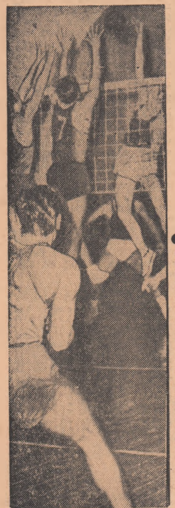
Fază din meciul Unirea Tricolor Brăila — Viitorul Bacău