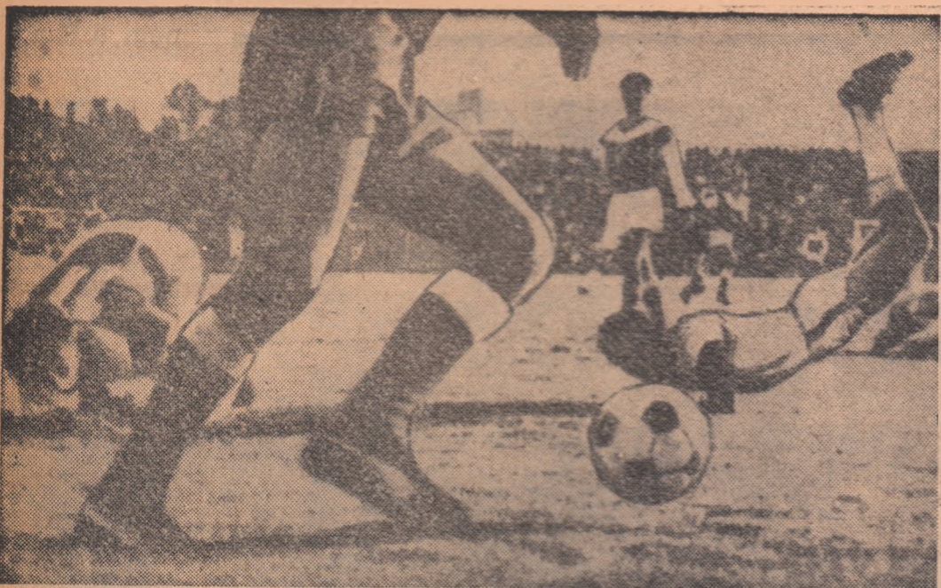
Așa a marcat Spiegler cu capul (în dreapta fotografia) golul victoriei, în meciul Israel - Australia (1-0), în primul meci al finalei zonei Asia-Oceania din preliminariile campionatului mondial de fotbal.