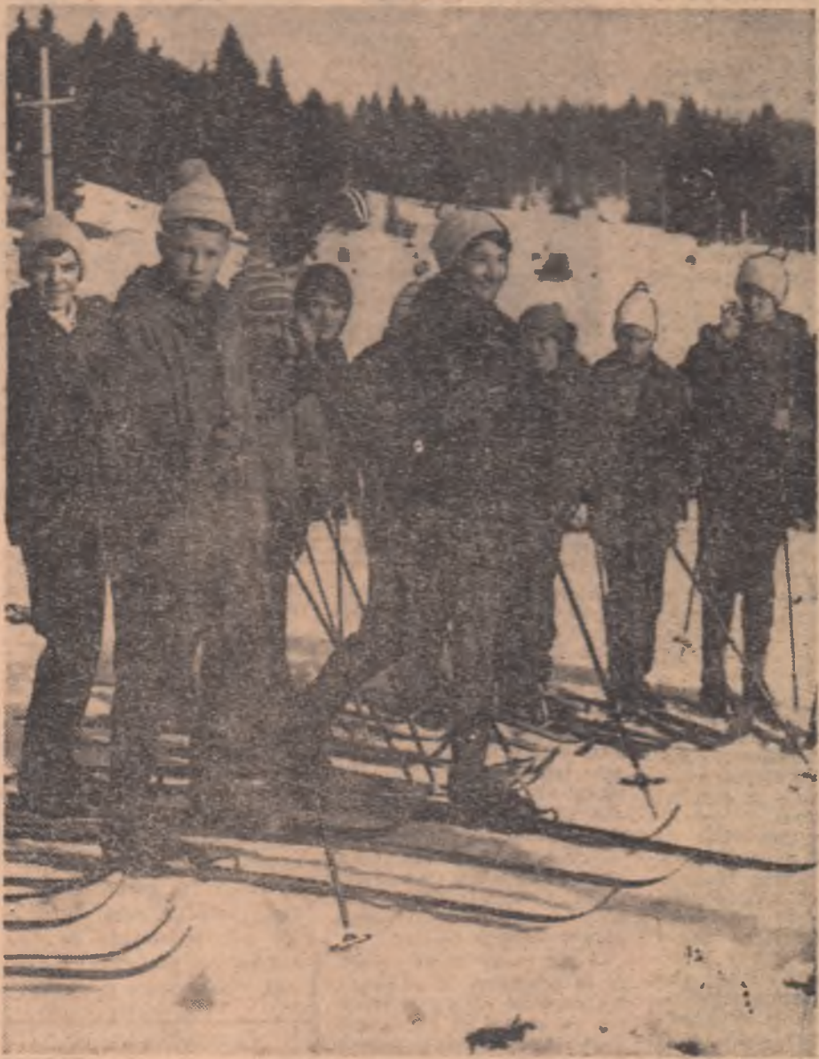
Iarna, în taberele școlare, schiul găsește o largă audiență în masa de elevi, aidoma imaginii din fotografia noastră, surprinsă pe una din piruetele din împrejurimile Brașovului.