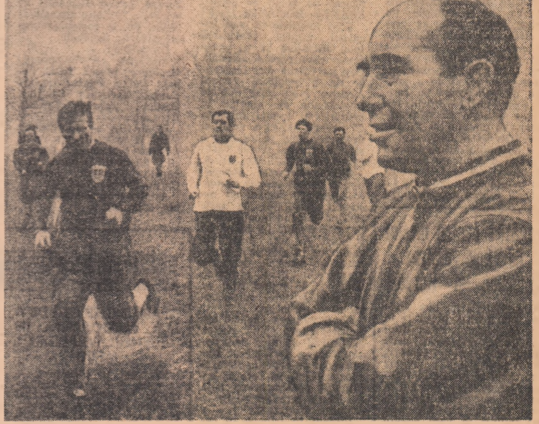
Sir Alf Ramsey - în tinutul de antrenament - urmărește cu ochi atent crosul circaciilor săi, dintre care va alege pe cel 18 „bun pentru C.M.”

• Bobby Charlton, punctul de sprijin al unui atac tinăr și impetuos • Geoff Hurst „omul-gol” • Renovare totală în dispozitivul apărării