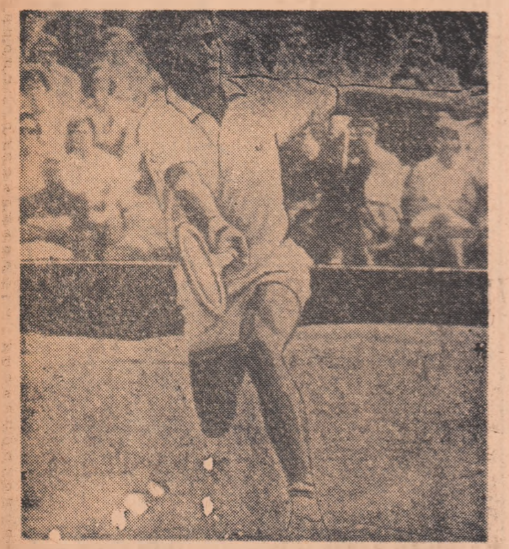
Ilie Năstase, în meciul decisiv al finalei inter-zone.