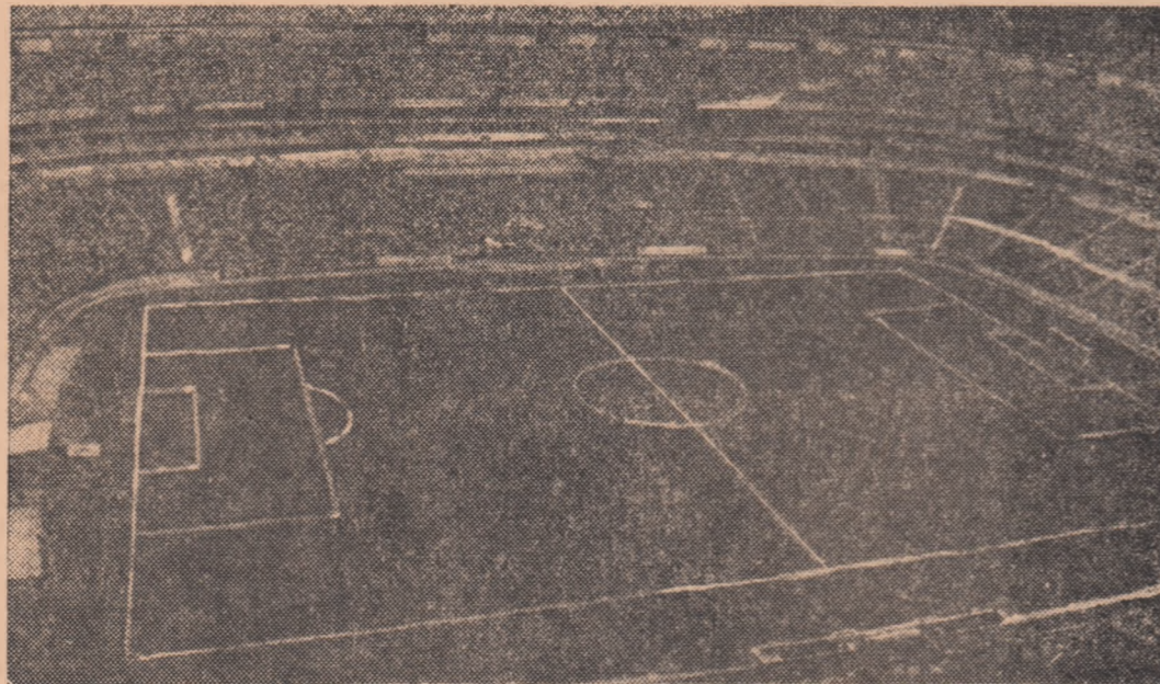
Stadionul din Mexico City pe care se va disputa finala „C.M. 1970”

● Organizarea campionatului mondial de fotbal costă 37 de milioane de pesos (aproximativ 3 milioane de dolari)! ● Până acum, o slabă vânzare a biletelor ● Numai 10 minute de antrenament, în pantofi de tenis! ● Un curs de arbitri și Congresul F.I.F.A. ● 500 de mingi la dispoziția echipelor ● Sistemul de desfășurare a turneului final și... cărțile de vizită ale orașelor gazdă.