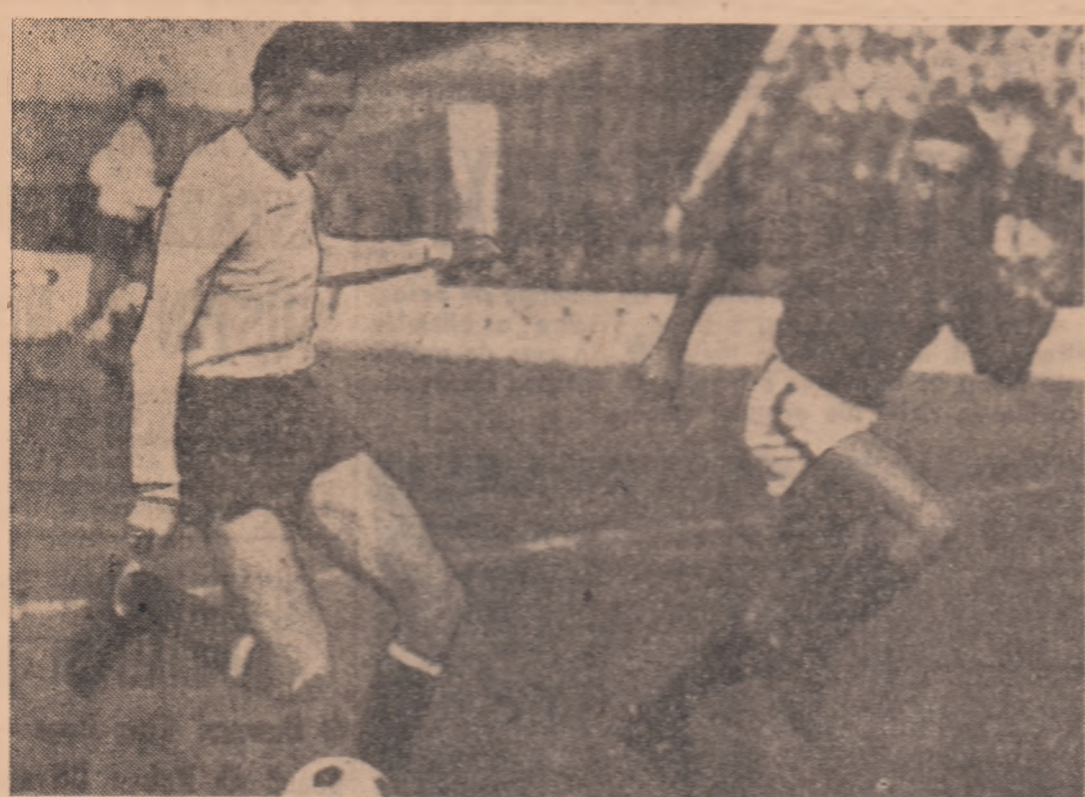
În octombrie, la București, portughezii au nădat pe ultima carte, dar tricolorii români au înfrânt dîrza opoziția a coechipierilor lui Eusebio, atactnd deseori (cum se vede și în imaginea noastră) buturile lusitanilor