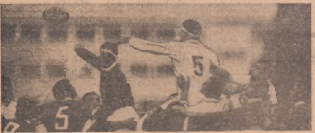
Turismul într-un spectaculos duel pentru balon cu Basilei