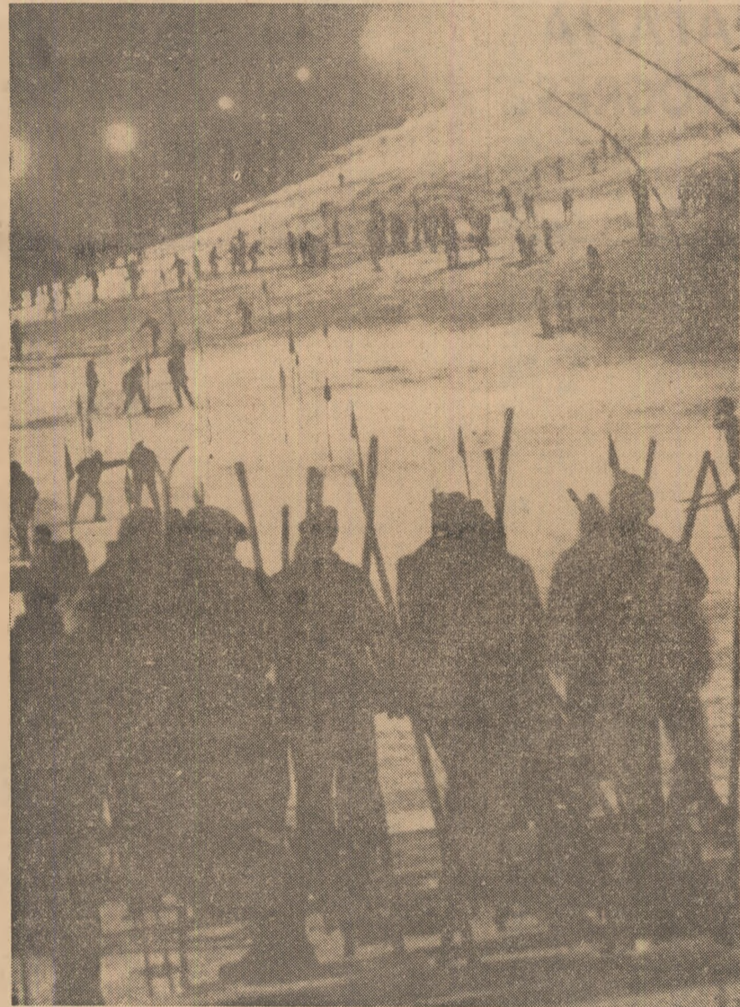
Alb și negru... pe pirtia Clăbucetului de la Predeal