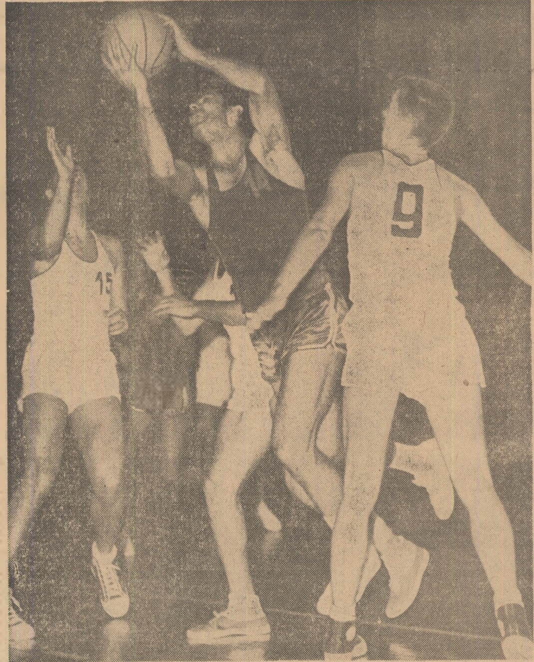
Pîrîndere impetuoasă. Dar unde-i apărarea?

Astăzi, urmează să sosească în Capitală o delegație a Uniunii Federațiilor de Cultură Fizică din Iugoslavia, condusă de Milosav Prelic, președintele acestui for sportiv. Oaspeții iugoslavi fac această vizită la invitația Consiliului Național pentru Educație Fizică și Sport din România.