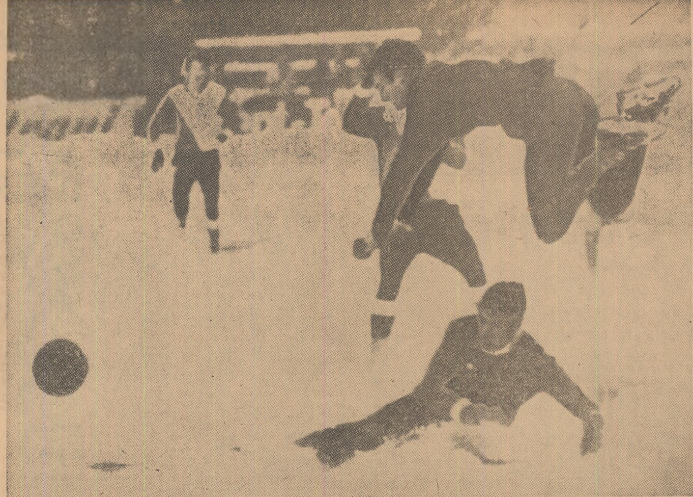
Fotbal pe zăpadă pentru europeni = handicap în pregătirea pentru turneul final al C.M.