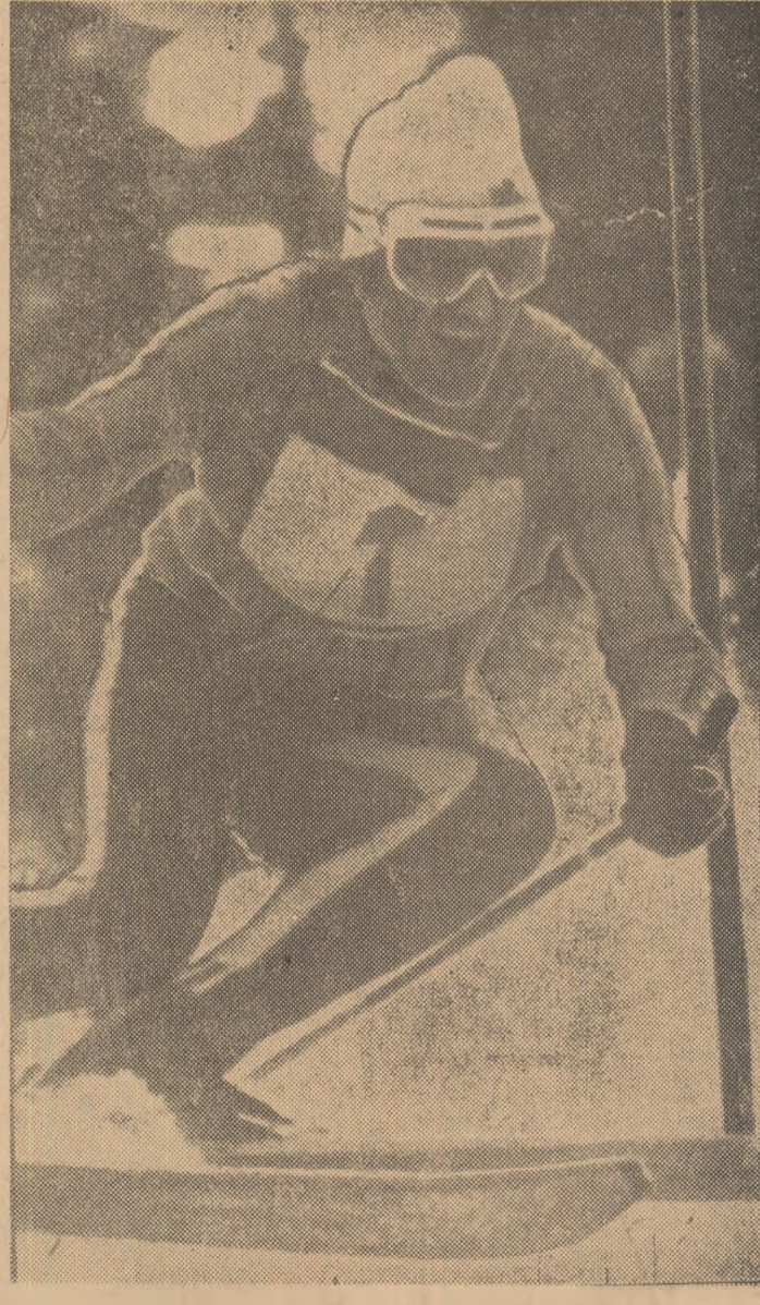
Deși a ocupat doar locul 4 în slalomul uriaș de la Adelboden, francezul Patrick Russel (în fotografie) a preluat șefia clasamentului individual în „Cupa Mondială”