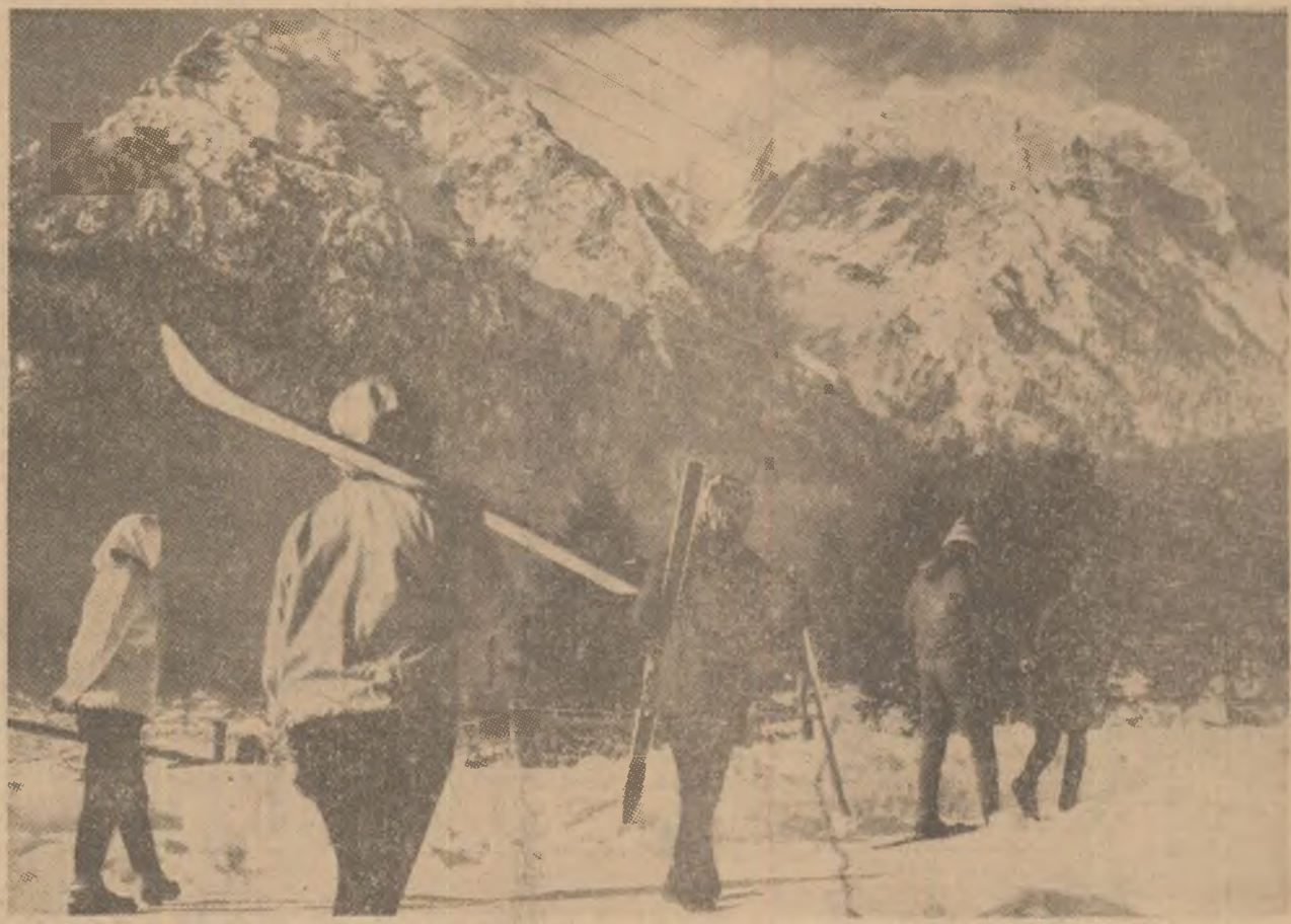
Sezonul de schi a intrat în toate drepturile lui în zona de munte. Dilema tinerilor din fotografie este îndreptățită! Pe care dintre pirtile din Bucegi să-și dovedească măiestria?