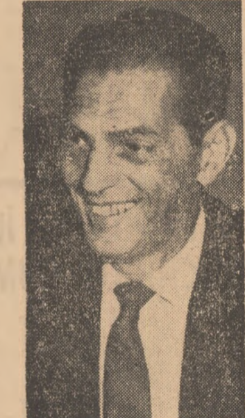
„priză”. Această agenție menționează că în rîndurile selecționatilor sportivi din Ciudad de Mexico, pe primul loc al favoriților se află Brazilia cu o cotă de 3-1. Urmează Anglia și Uruguay (7-1); Mexic și R. F. a Germaniei (8-1); Italia, Peru, U.R.S.S. (10-1).

observațiile antrenorului Joao Saldanha, care, după ce a asistat la înfrîngerea Portugaliei la București, s-a întors aici repetând insistenț că „selecționata României poate provoca surprize în Cupa Mondială — 1970”. Saldanha a rămas impresionat de spiritul combativ și seriozitatea jucătorilor români, apreciind că echipa are o „anărare și suară, mijloacele abilități și înfășurări rapide”. Dacă sub aspectul componenței grupe a trei e privită ca foarte dificilă în componență și se atribuie avantajul de a disputa optimele de finală în localitatea cu cea mai bună climă — Guadalajara situată la o altitudine de 1.710 m (celelalte trei: Toluca, Puebla și Leon — plătate la o altitudine mai mare) Guadalajara are o populație de peste 1.200.000 locuitori, un stadion cu o capacitate de 71.000 locuri și în luna iunie media temperaturii variază între 22 și 26 de grade. Guadalajara se află la 583 km de capitala Mexicului și este vestită pentru frumusețile sale, fiind supranumită de mexicani „perla vestului”. Referindu-se la tragerea la sorți a grupelor turneului final al campionatului mondial de fotbal, agenția Prensa Latina scrie, printre altele: „Potrivit observatorilor, pentru cîteva echipe din rîndul protagoniștilor C.M. ta bioul a început să se întunece. Principalele afectate sînt Brazilia și Anglia care vîd în Cehoslovacia o mare amenințare și observă cu neliniște obligatia de a se întîlni cu puțin cunoscuta echipă a României, care ar putea oferi mai mult decît o singură sur-