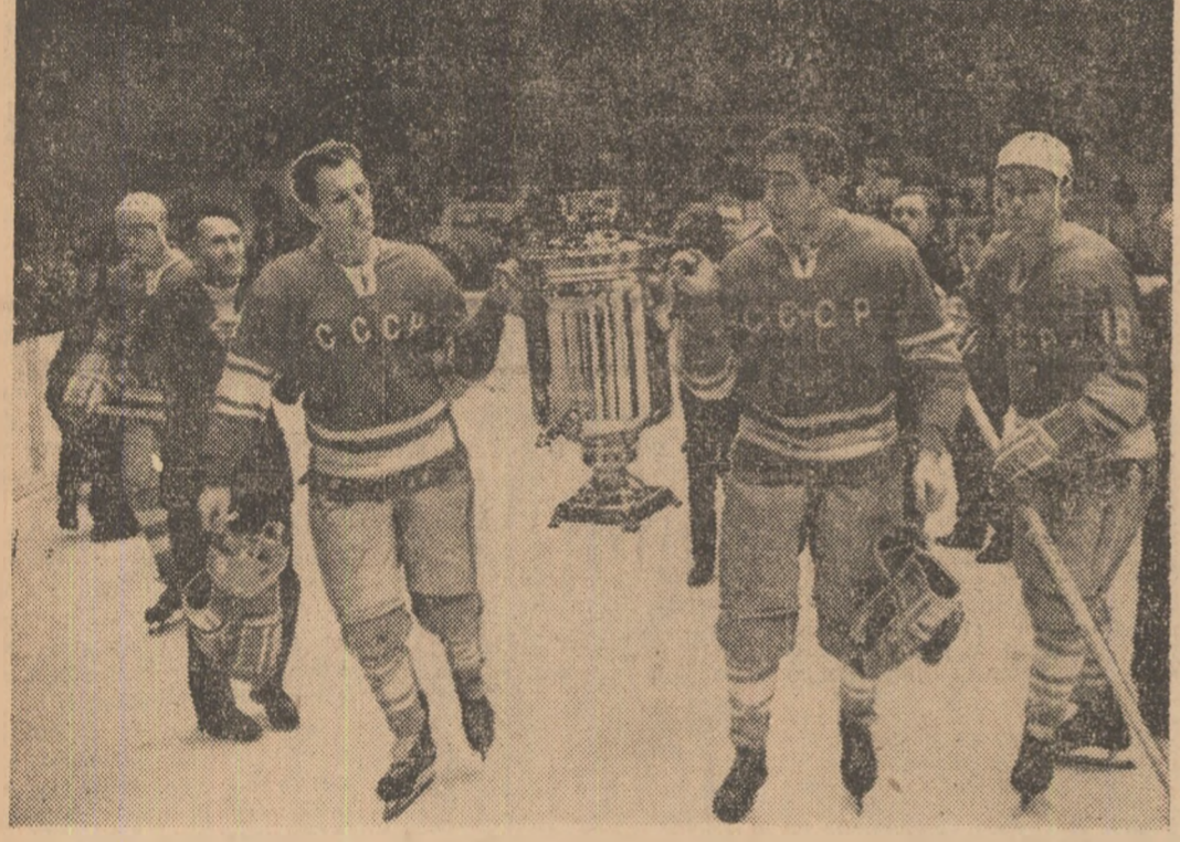
Un uriaș succes pentru Tula a răsplătit pe hocheiștii reprezentativei U.R.S.S., victorioși în turneul internațional din decembrie, la Moscova. Ei au cîștigat mai bune șanse de a repeta performanța în apropiatele „mondiale” de la Stockholm (grupa A)