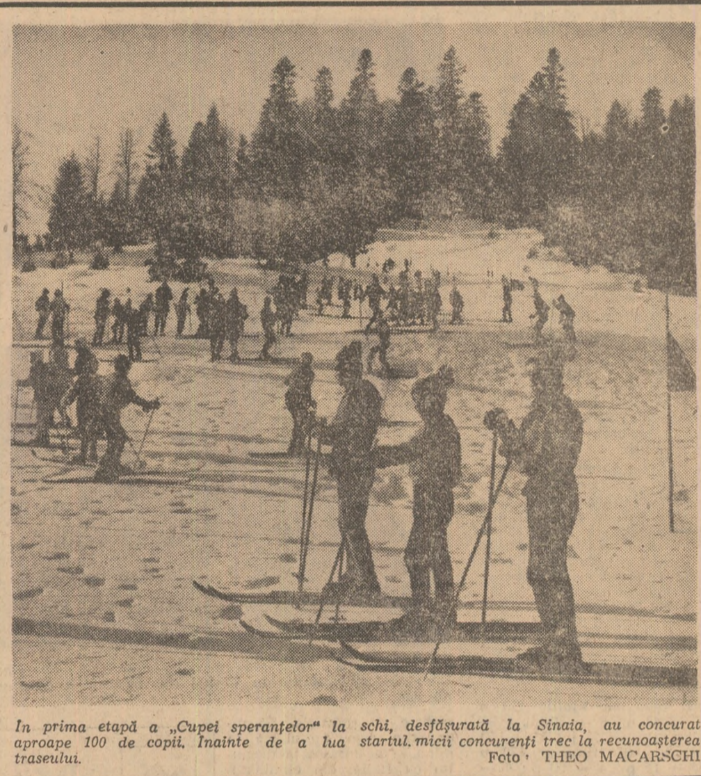
În prima etapă a „Cupei speranțelor” la schi, desfășurată la Sinaia, au concurat aproape 100 de copii. Înainte de a lua startul, micii concurenți trec la recunoașterea traseului.

Astăzi seară la Londra, are loc meciul amical dintre primele selecționate ale Angliei și Olandei.