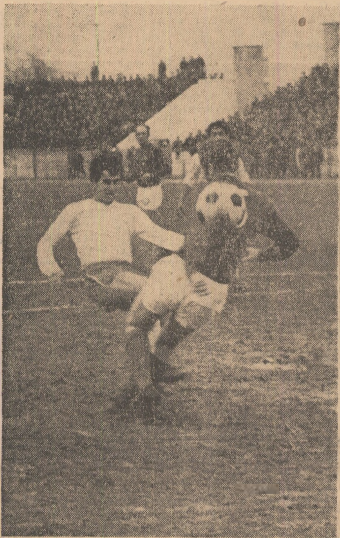
Până, unul dintre cei mai percutanți atacanți dinamoviști, a reușit o nouă breșă...

BACĂU, 13 (prin telefon, de la trimisul nostru). Cea de a doua partidă dintre echipele Dinamo și Kilmarnock a fost, în bună măsură, asemănătoare, ca aspect general, cu prima confruntare, disputată în urmă cu aproape o lună în Scotia. Numai că, de astă dată, rolurile s-au inversat. A dominat insistent și și-a creat nenumărate ocazii favorabile de gol formația băcăuană, în timp ce onsepeștii s-au văzut nevoiți să se rezume, cu rare excepții, la un joc de apărare.