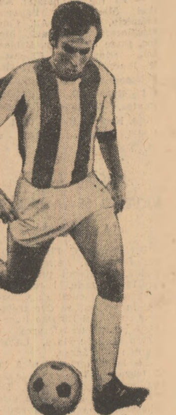
Excelentul Geacici n-a putut califica echipa iugoslavă în turneul final al C.M., dar ea figurează, totuși, printre fruntașele clasamentului alcătuit de I.S.K.

4. R.F.R. GERMANIEI, SUEDIA. Formația vest-germană și cea română sînt neînvinse. Echipa R.F.G. are un gol-averaj excelent și un bilanț multumitor: 7 4 3 0 20:5 11