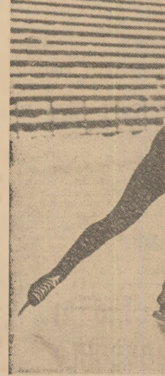
Norvegianul Dag Fornæss, patinatorul de 21 de ani, care anul trecut a lăsat lumea sportivă promovînd de la rolul de outsider la cel de campion mondial, atacă de azi și titlul continental, pe inelul de gheață de la Innsbruck.

nat din zahăr, hîrtie colorată și polistiren figurine, bibelouri... dulci, hocheiști în miniatură și o machetă a patinoarului artificial.