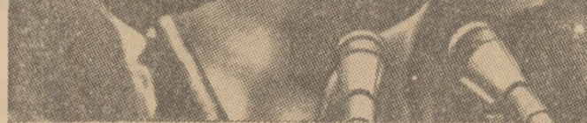
Doi celebrități în fața microfonului: crainicul reporter Gyorgy Szepesi și Gyula Grosics

— sint acuzați antrenorii. Dar în realitate nu este chiar așa. ANTRENORUL NU TREBUIE SĂ FIE „TAPUL ISPĂȘITOR”. Cauzele lipsurilor pot fi multiple și complexe. În munca mea mă voi strădui să analizez multilateral toate problemele și să contribuie la dezvoltarea sportului la clubul pe care-l conduc — a spus Grosics în încheiere.