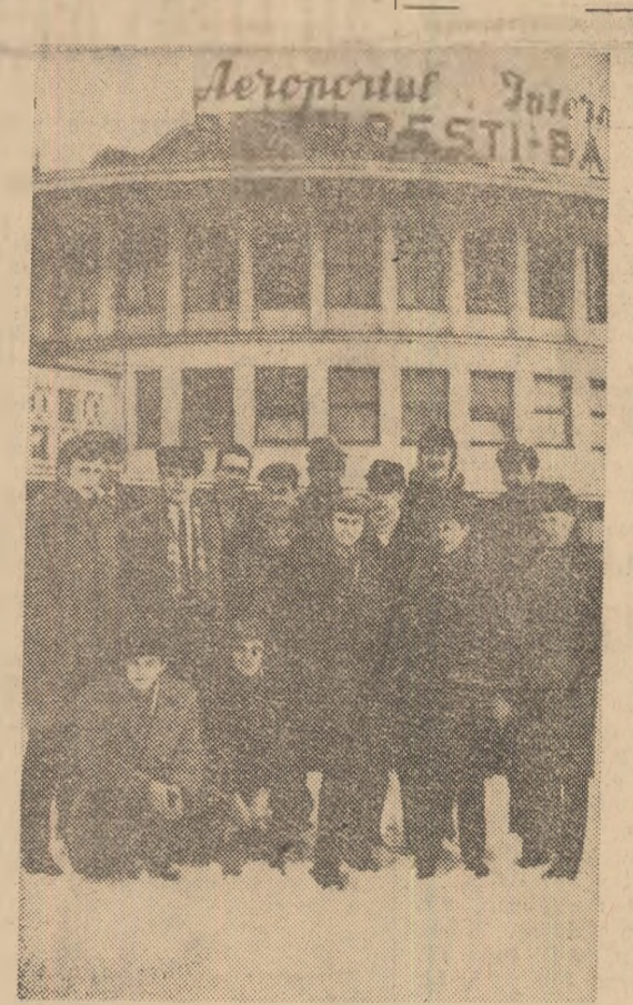
Baschetbaliștii de la Polonia-Varșovia la cîteva minute după sosirea în Capitală

Comisia F.I.B.A. a desemnat pentru acest joc arbitrii Nuren Demirdöğen (Turcia) și Ferenc Hornyak (Ungaria). Va fi prezent duminică seara în sala Floreasca și Alexander Boșkov (Bulgaria), cu funcția de comisar al F.I.B.A.