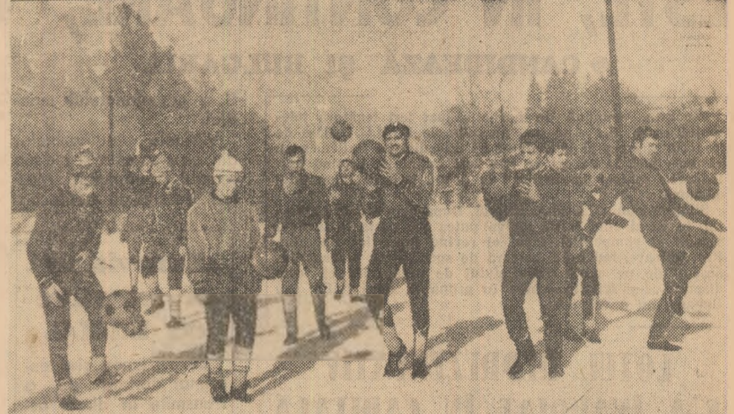
Petroliștii continuă pregătirile la Sinaia. Foto: Ion POPESCU — Ploiești