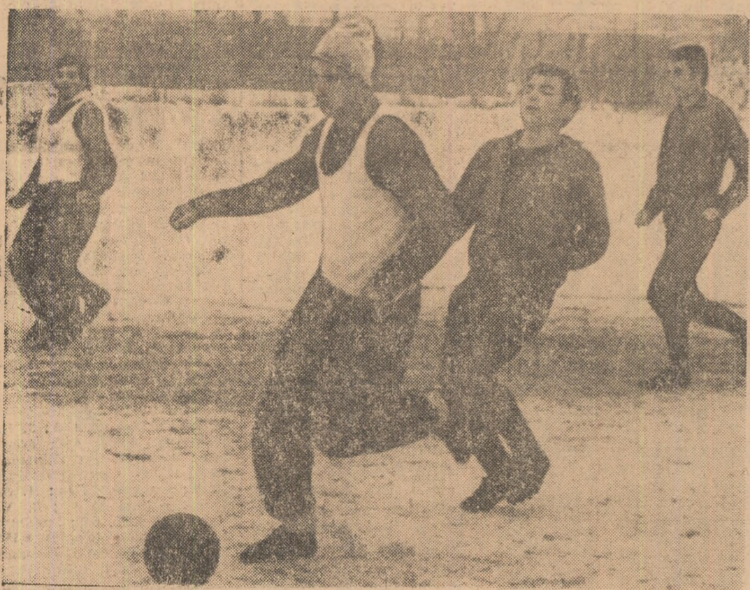
Correspondență specială de la IOAN CHIRILĂ