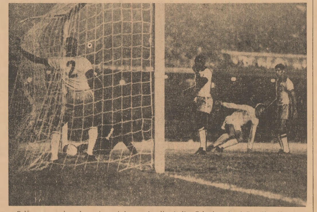
Pele: „...șansele cele mai mari le au Anglia, Italia, Cehoslovacia și Brazilia”. Vor reuși oare coechipierii „Perlei Negre” să repete performanța din ziua de 15 iunie 1969, cînd Brazilia a învins Anglia cu 2-1? Iată, în fotografie, o fază din acest meci disputat la Rio de Janeiro: Colin Bell înscrie golul britanicilor.

buie să se pregătească cu mare atenție, deoarece toate echipele calificate în turneul final sînt greu de învins, fără o pregătire temeinică. Pele a declarat în încheiere că va juca pînă la vârsta de 33 de ani și că dorește să participe și la viitoarea ediție a campionatului mondial din R.F. a Germaniei.