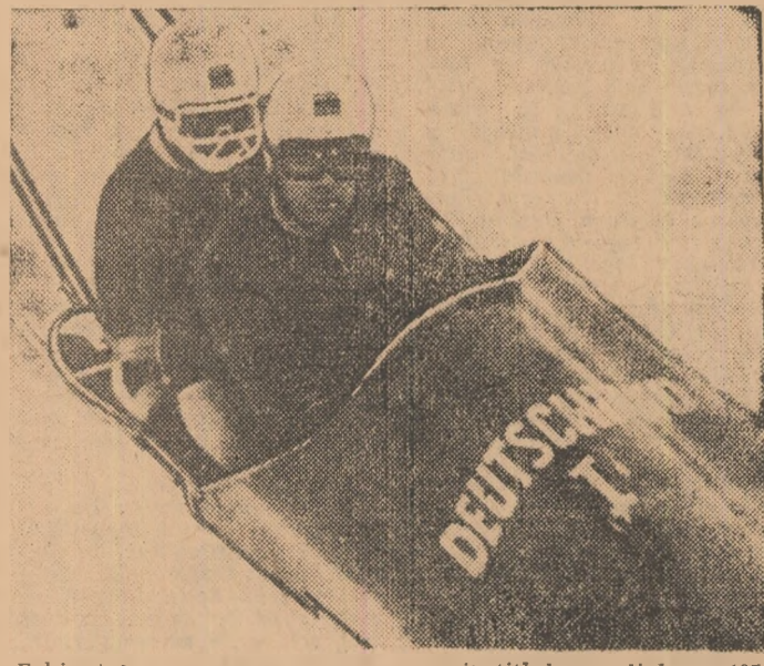
Echipajul vest-german, care a cucerit titlul mondial pe 1970.

In confuzia generală a festivității de premiere, premiile pentru locul 6 sînt mai întîi uitate, pe urmă regăsite, și, în sfîrșit, înmîinate, constatîndu-se însă că ele erau de fapt destinate... probei de bob 4 persoane, ceea ce față de pretențiile superioare ale lui Panțuru în întrecerea următoare nu poate fi interpretat nici măcar ca o urare... CLASAMENT: 1. R. F. a GERMANIEI I (Floth-Bader) 5:03,39; 2. R.F. a GERMANIEI II (Zimmerer-Utzschneider) 5:06,86; 3. ELVEȚIA I (Caviezal-Candrian) 5:09,2; 4. ITALIA II (Vicario-Carlesso) 5:09,75; 5. ITALIA I (De Zordo-Frassinelli) 5:10,17; 6. ROMANIA I (Panțuru-Zangor) 5:10,52; 7. S.U.A. I (Lamey-Huscher) 5:10,70; 8. AUSTRIA II (Dellekarth-Grat) 5:10,80; 9. ELVEȚIA II (Stadler-Schärer) 5:11,47;