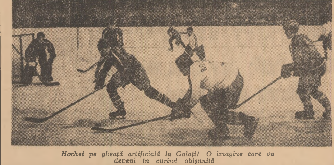
Hochei pe gheață artificială la Galați! O imagine care va deveni în curînd obișnuită