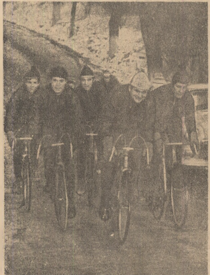
Din primele zile ale noului an, cîștii și-au reluat pregătirile, Teri la amiază, fotoreporterul nostru AUREL NEAGU l-a surprins pe elevii antrenorului prof. Nicolae Vacu plecînd la rula. Cîți dintre ei vor realiza în noul sezon performanțe care să le dea dreptul la un loc la startul „Turului României”?

Miine, în primul episod: 24 DE ANI, DE LA PROIECTE LA ÎMPINIRI