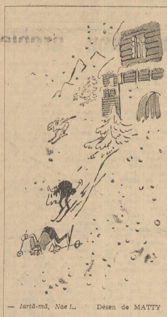
— Iartă-mă, Nae!... Desen de MATTY