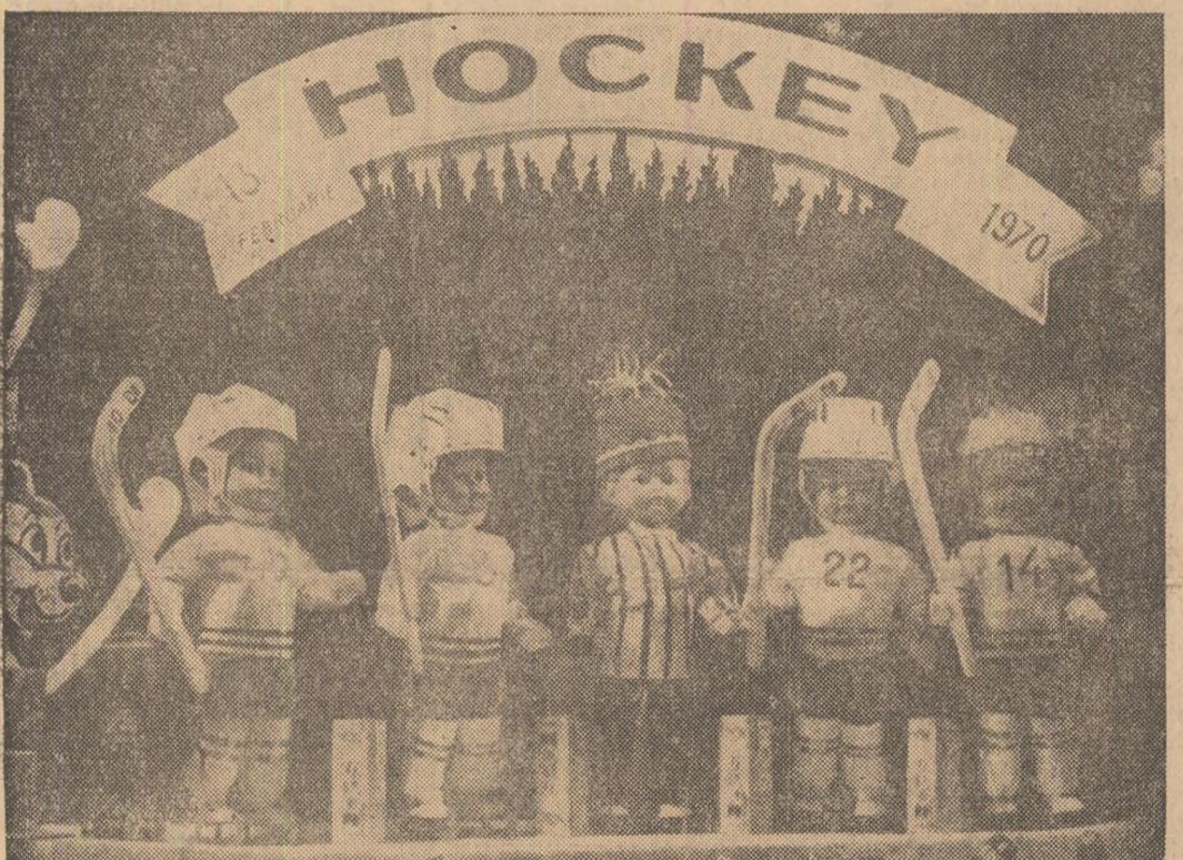
GALAȚIUL SUB SĂRUTUL... HOCHIEIUI! Marele oraș dumărean trăiește intens apropierea unui eveniment sportiv în premieră: JOCURILE GRUPEI C ALE CAMPIONATULUI MONDIAL DE HOCHIEI PE GHEAȚĂ. Mirajul pucului și al crosului în aștră atrag pe decoratori care au amenajat numeroase vitrine dedicate intrerătorilor care vor începe la 13 februarie. Iată aceste păpuși, gata par să se avante pe lăcuți gheații. Poate că n-ar fi rău dacă, până la începerea competiției, asemenea gustări ar putea face pasul din vitrină în rafturile magazinelor. Săoretim că s-ar găsi destui amatori (nu numai printre copii) de o frumoasă amintire sportivă.