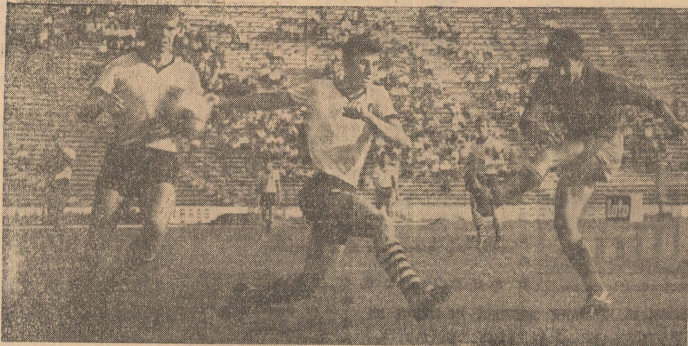
Fază dintr-un meci de tineret opunind echipa Steaua și Universitatea Cluj