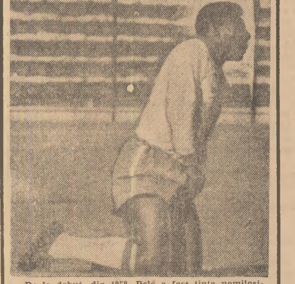
De la debut, din 1958, Pelé a fost jinta nemilosilor aparători. Iată-l într-un clipă ingenunchiat după un contact dur cu unul din adversarii. Cînd se va ridica însă...