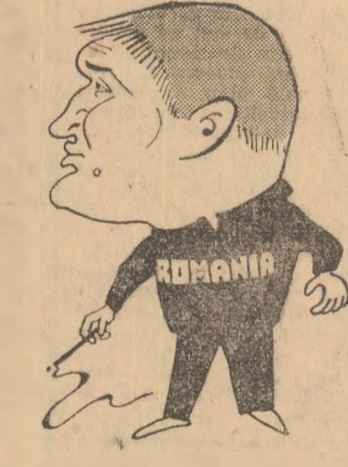
ION CORNEANU Văzut de AL. CLENCIU

...Iată-ne împreună cu fotoreporterul Theo Macarșchi la unul din primele antrenamente. Antrenorul emerit Ion Corneanu dirija un grup masiv de sportivi. Aproape la unison, cei peste 40 de luptători, ai ambelor loturi, executau exercițiile, noi sau cunoscute, indicate de antrenor. După două ore, cind lecția luase sfârșit, chipurile sportivilor erau brăzdate de suvite groase de năduseală. — Arbitrii — a ținut să precizeze antrenorul Ion Corneanu — la recențele indicații ale Biroului prezidențial F.I.L.A. vor deveni în curind extrem de exigenți. Se preconizează, de pildă, desființarea deciziei de egalitate fără puncte tehnice. Luptătorii respectivi urmind a fi descalificați, iar penalizarea de pe urma unei astfel de decizii mărindu-se la 5 puncte, ceea ce ar lua orice speranță celor în cauză. Descalificarea pentru pasivitate se poate deia chiar și în prima repriză (măsură deja aplicată). De asemenea, la fiecare ieșire de pe sală în timpul luptei se va da un punct tehnic adversarului. Așa că am toate motivele să iau măsuri de precauție