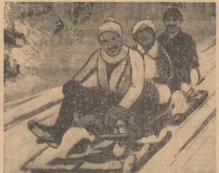
Unul din echipajele participante la concursurile de la Brasov-1930. După cum puteți observa, era un echipaj mixt de 3 persoane. Obligat, pe atunci, se concursa cu 5 echipieri, dacă... mărimea bobului o permitea!