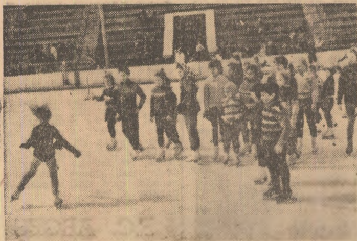
Pentru acești copii „joaca” a devenit — pe neștiute — ceva serios. O pregătire pentru marile competiții care consacra campioni ai continentului și ai lumii.

Acum vreo douăzeci de ani nu se prea putea vorbi de o școală sovietică a patinajului artistic. Abia în anul 1958, patinatorii sovietici au cucerit primul lor trofeu în-tr-un campionat european: medalia de argint la proba de perechi cu Nina și Stanislav Juk. Ei au repetat acest succes în anii 1959 și 1960. După 1960, excelențele cupluri Ludmila Belousova și Oleg Protopopov, Tatiana Juk și Alexandr Gorelik cuceresc în repetate rânduri titlurile de campioni mondiali.