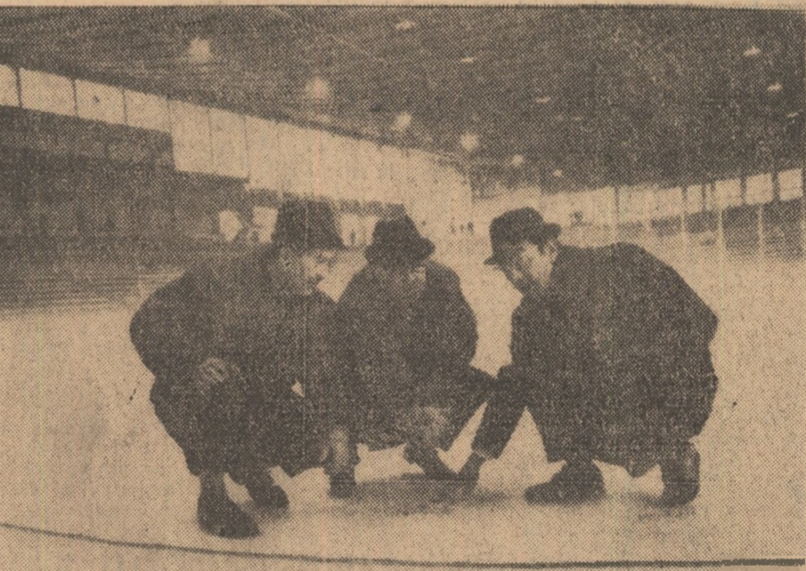
Campionatul mondial de hochei — grupa C