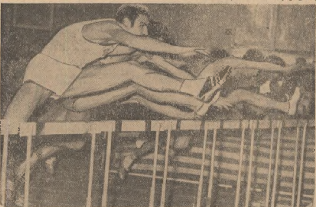
Aspect din proba de 50 mg, câștigată de atletul sovietic Aleksandr Demus