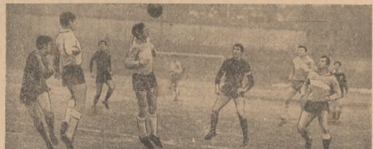
Ieri, în Capitală și în provincie, echipele de fotbal divizionare au susținut noi jocuri de verificare în vederea reluării activității competiționale. În fotografia noastră, un aspect de la meciul Metalul București —

Spartak Varna, disputat pe terenul din str. dr. Stoicovici