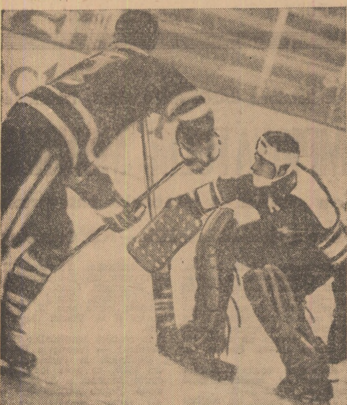
De astă dată portarul Rigolet a reușit să respingă pucul salvând echipa Elveției de la un gol, ce părea imparabil, în meciul cu S.U.A.