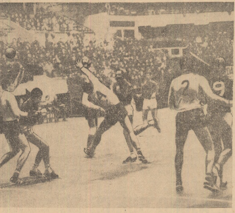
O imagine din partida România — Danemarca, meci în care „tricolorii” au obținut o victorie prețioasă și totodată calificare în finala campionatului mondial