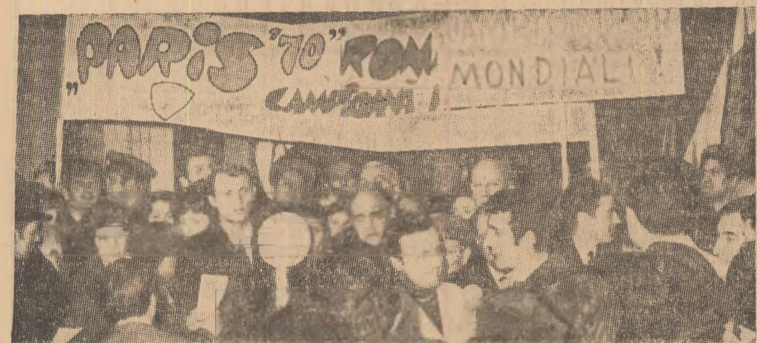
Incurajați de suporterii, handbaliștii găsesc... resurse pentru a face față asaltului gazetarilor