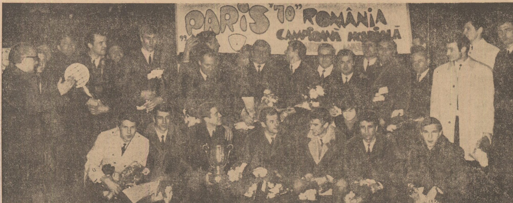
Fericiți că au sosit acasă, emoționați de entuziasta primire ce le-au făcut-o cei aproape 10.000 de bucureșteni veniți să-i întâmpine la aeroport, cu brațele încărcate de flori, cu cupele de învingători, tricolorii, antrenorii și conducătorii delegației pozează fotoreporterilor în „decorul” pancartelor