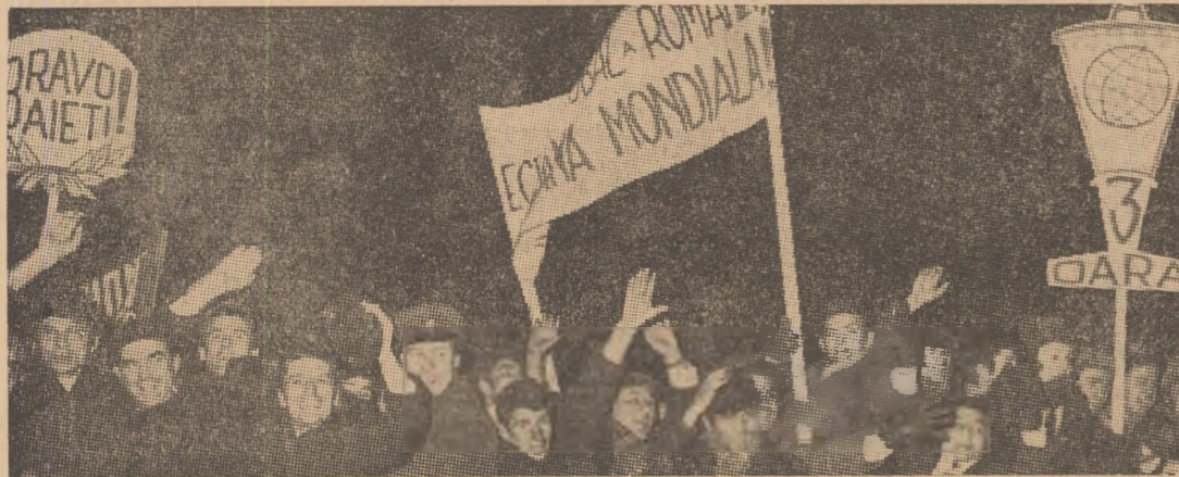
Miile de bucureșteni îi aplaudă cu căldură pe cei ce au cucerit la Paris laurii victoriei

în cuvîntul de răspuns — partidului și guvernului pentru grija pe care le-o poartă tuturor sportivilor țării, pentru condițiile excelente de