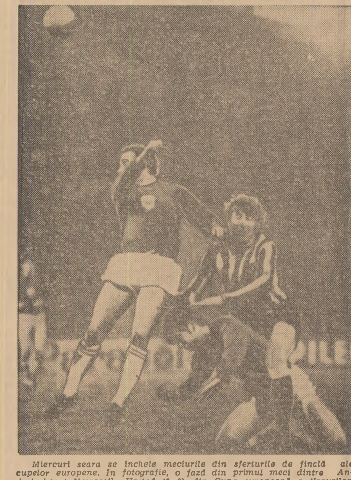
Miercuri seara se încheie meciurile din sfer-turile de finală ale cupei europene. În fotografie, o fază din primul meci dintre Anderlecht și Newcastle United (2-0) din Cupa europeană a sîrgurilor.