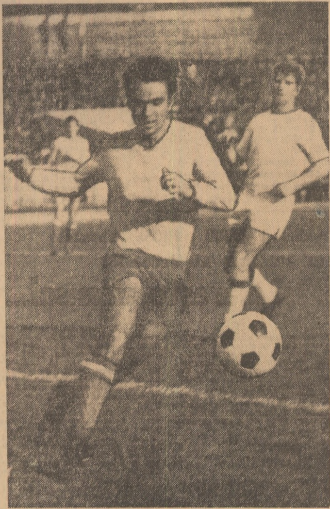
Tufan în acțiune

Aproximativ 6 000 de spectatori au urmărit, ieri, în tribunele stadionului din șos. Ștefan cel Mare, jocul de verificare a lotului reprezentativ, desfășurat în compania echipei de tineret-rezerve Dinamo București și încheiat cu victoria selecționabililor la scorul de 4-2 (2-2).