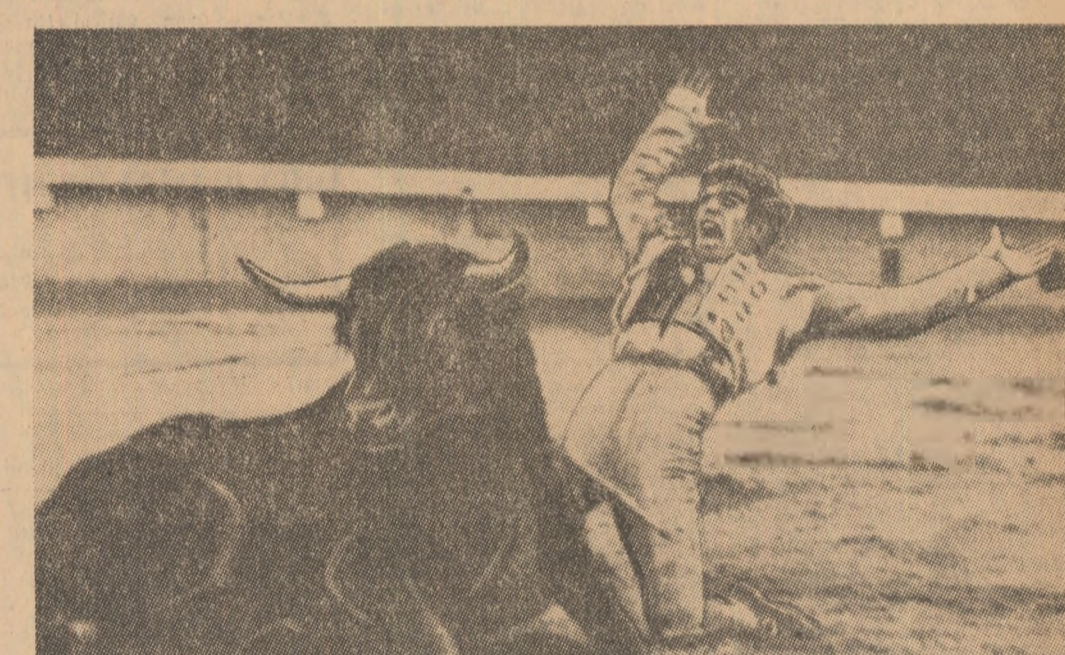
Citeadată trebuie să implori taurul să vină la luptă... Cam așa dă impresia acest instantaneu surprins într-o recentă corridă, în care taurorului spaniol Blas Romero „Platanito” și-a completat curajoasele asalturi cu tot soiul de giubșlucuri inedite, spre deliciul spectatorilor

Un caz unic s-a petrecut nu demult în orașul finlandez Kalavaara, în timpul unui meci de fotbal. Pe o temperatură de minus 15 grade se întîneau două echipe ale combinatului de celuloză din orașul respectiv. Superioritatea uneia din echipe era așa de mare încît portarul acesteia nu a intervenit aproape deloc în joc. Și s-a întîmplat ceea ce era de prevăzut: portarul respectiv a trebuit să fie dus la spital unde s-a constatat că suferise seroase degerături!