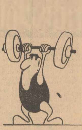
Bogodnica halterofilului visează... („SPORTOWIEG”-Varșovia)