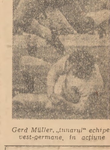
Gerd Müller, „tanarul” echipei vest-germane, în acțiune