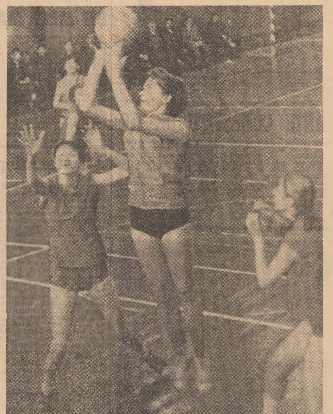
Un contraatac și Maracu, jucătoarea Constructorului, ajungînd în fața panoului, aruncă la coș. (Fază din meciul Constructorul—Progresul).

Clarificări în pozițiile cheie ale clasamentelor • De ce 2-0 și nu 20-0? • Regulamentul F. I. B. A. nu este infailibil