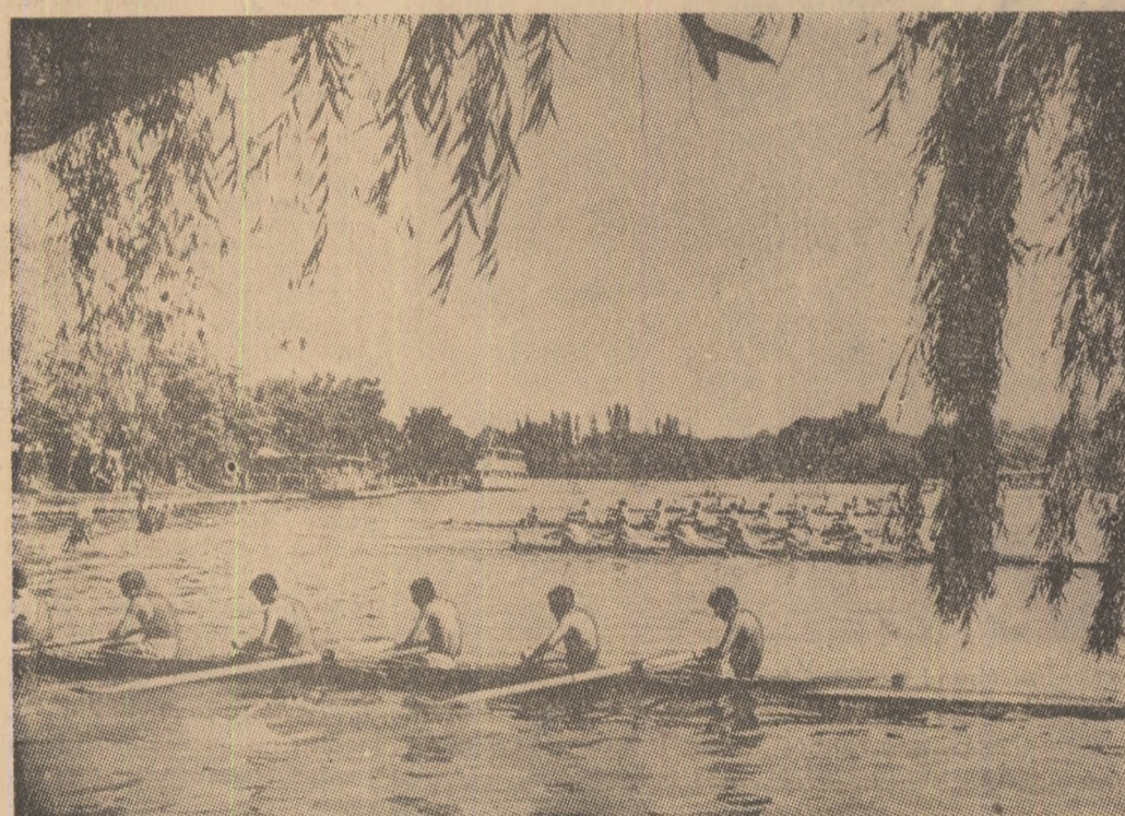
Razele soarelui încălzesc tot mai puternic apele Herăstrăului, chemând în joc plăcuta oră de relaxare sau antrenament sportiv — cum puteți urmări și în imaginea surprinsă de fotoreporterul nostru, M. FELIX

motiv pentru a spera că disputa se va situa la un nivel superior, că trăgătorii noștri vor reuși rezultate și mai bune decât în „Cupa Primăverii”. Ultimele teste internaționale de amploare, etapă de selecție pentru loturile reprezentative, concursul organizat de clubul sportiv Dinamo este așteptat cu interes de sportivi, tehnicieni și antrenori.