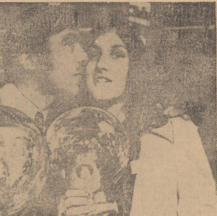
Iată-i pe cei mai buni schiori ai lumii din sezonul care s-a încheiat recent. Karl Schranz (Austria) și Monique Jacot (Franța), cărora Li s-a închinat marți seara la Evian (Franța) Cupa mondială.