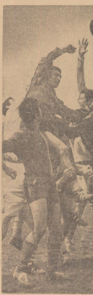
Duminică, în Capitală, a fost un veritabil festival rugbystic. Pe patru stadioane și terenuri — Ghencea, Tineretului, Parcul Copiului și Vulcan — echipe din divizia A și finaliste ale turneului național de juniori și-au disputat cu ardore șansele în partide care în general au plecat pentru frumusețea sportului cu balonul oval. (Amănunte, în grupajul de cronici din pag. a 2-a). Fotografia noastră reprezintă o secvență din partida Steaua — Rulmentul: o dispută acerbă pentru balon, după o repunere din margine.

În triunghiularul România — Italia — Ungaria