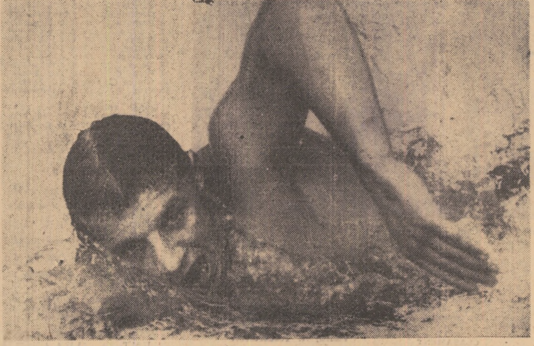
Recordul mondial (4.04,0) în cursa de 400 m liber și victoriele sale asupra celor mai puternici craiuși de peste Ocean i-au impus pe Hans Fassnacht drept învingător nr. 1 al seronului trecut și unul din marii favoriți ai întrecerilor pe distanțe lungi din cadrul campionatelor europene din 1961.