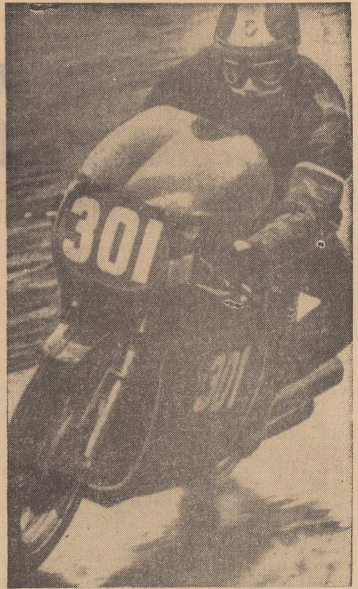
Cunoscutul campion italian Giacomo Agostini (în foto) își menține poziția de lider al campionatului mondial de motociclism, după disputarea „Marelui Premiu al Franței”, la Le Mans. El s-a clasat primul la clasa 500 cmc, realizînd o medie orară de 134,216 km. Iată ceilalți câștigători: 250 cmc — Gould (Anglia); 125 cmc — Brauld (R.F.G.); 50 cmc — Berdi (Spania)