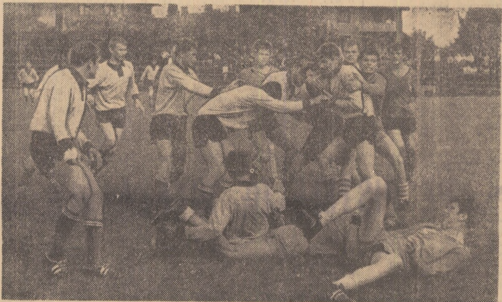
Fază de la unul din meciurile din cadrul turneului final.