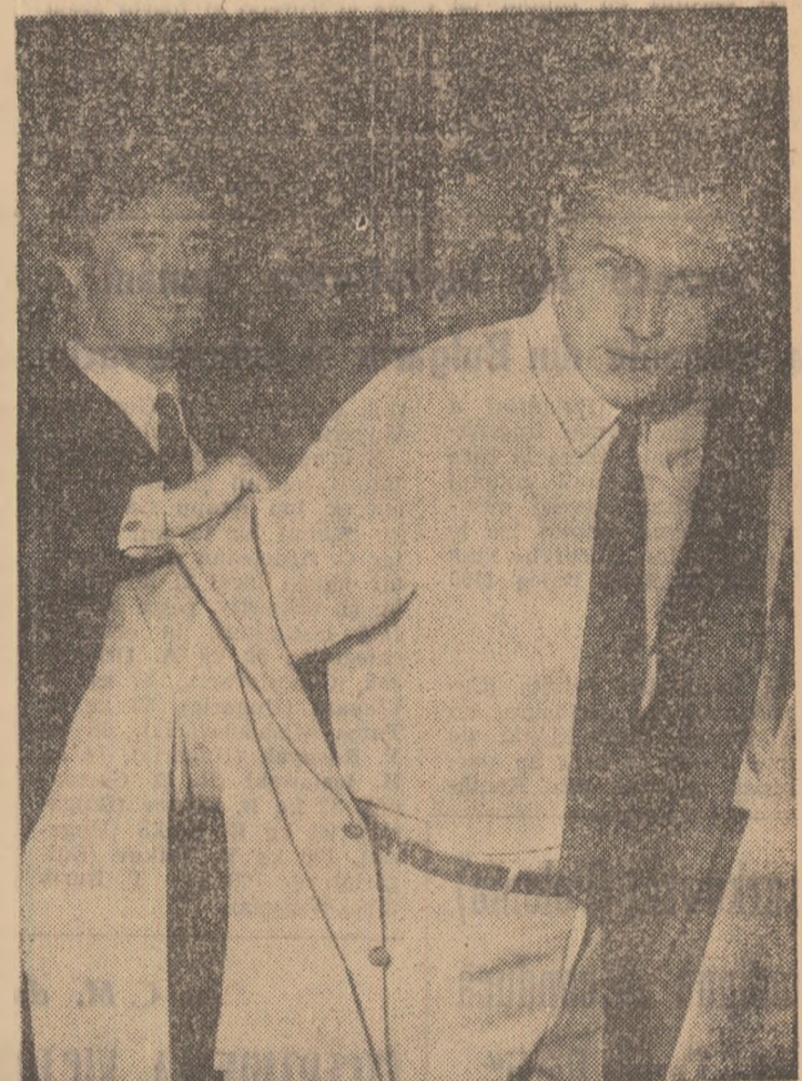
Doi vedete ale fotbalului vest-german: Gerd Müller (stînga) îl ajută pe prietenul său de club și echipă, Beckenbauer, să-și îmbrace halata. La G.M., servitiile se pot inversa: Beckenbauer îl va servi probabil (cu arieta) pe Müller!

Etapa viitoare: Unirea C. - Flacăra, Carpați - Comerțul, Progresul B. - Progresul C., Autobuzul - Prahova, I.R.A. - Unirea, Sirena - Caraimanul, Chimia - Sportul, Petrolul - Dacia.