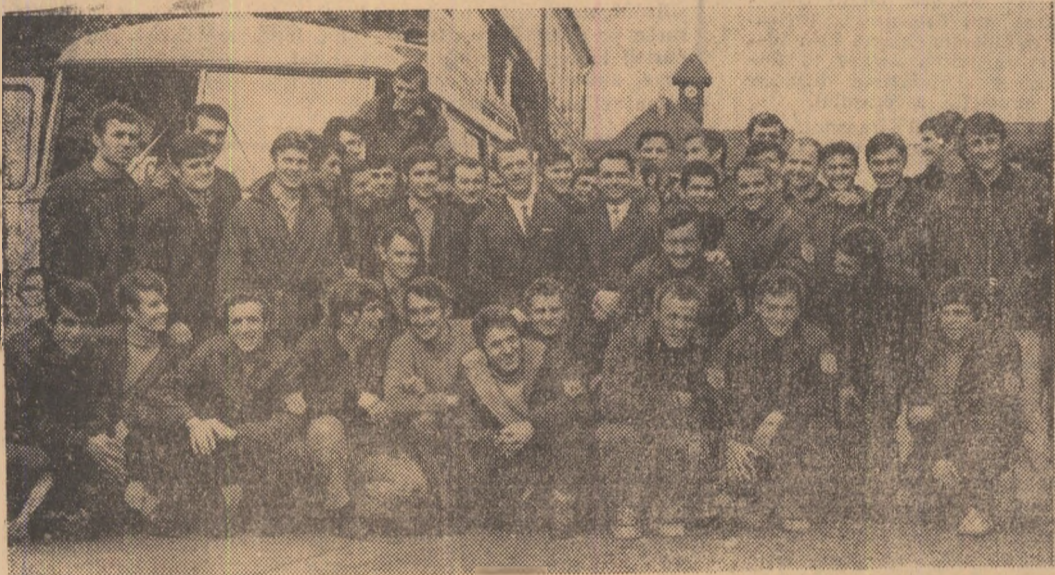
Brigadierii de la I.E.F.S. înainte de plecare