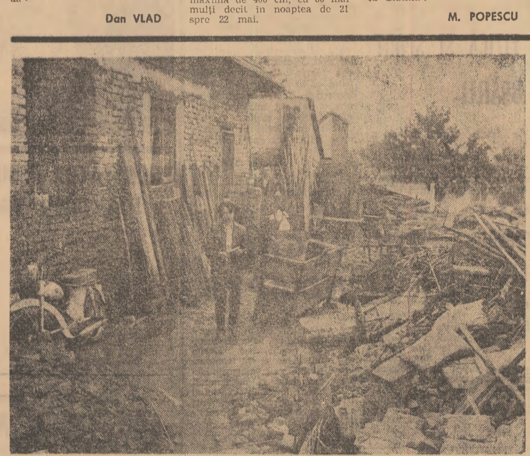
La Alba Iulia — ruinele rămase în urma invaziei apelor. Dar oamenii nu se lasă înfrînși. Munca de reconstrucție a început

(Urmare din pag. 1) întrerupt de bărbăți ce domnă înălțimea digului dinspre Prut. Aici, pe digul lung de aproape 28 de kilometri, noaptea trecută, biciuți de vînt, colecșiile de apă, străluminăți arare de lumină felinarelor sau lămpile lanterne, oamenii au luptat eroic cu besmetica apă, domolindu-i tentativa de a măcina malul, de a surpa pămîntul, pentru a năvăli dincolo. Ziua nu-i destinată odihnei. Azi, de la gura de vărsare a Prutului în Dunăre, de la Ghimia pînă aproape de Oancea, am văzut mii de oameni, în neostenita lor furnicare anonimă, bătînd parii cu baroașele, în apa ușor încrețită, dar mult lăitîz dincolo de vadul ei normal, pînă la poala digului. I-am văzut tîntind scinduri, completînd cu baloturi de paie, cu saci umpluți cu nisip, cu sacii cu tot ce te lăși la îndemînă, numai să stăvilească stîlbia. Sînt bărbăți în toată firea, muncitori și meșteri din fabricile orașului, sînt membri ai brigăzilor patriotice, dar mai ales sînt mulți tineri, ucenici și studenți. L-am văzut pe țicărul tractorist Constantin Neagu de la Oltului de înțreținere funciară și gospodărire a apelor, pasionat motociclist, mînuindu-și tractorul S-650 cu o îndemînare de inviat și cu velenități acrobatiche impuse de solul milos al unui