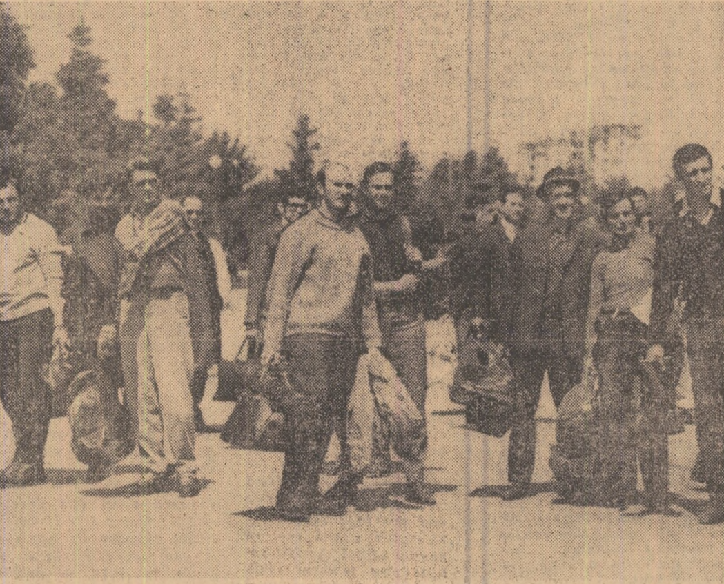
O parte dintre sportivii și tehnicienii sportivi din municipiul București, în drum spre locul de imbarcare.

Un detașament de sportivi și tehnicieni sportivi din București au plecat în județul Ialomița