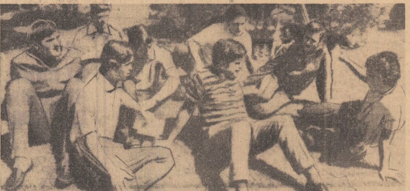
Tricolorii români petrec clipe de destîndere în parcul din jurul hotelului Gran