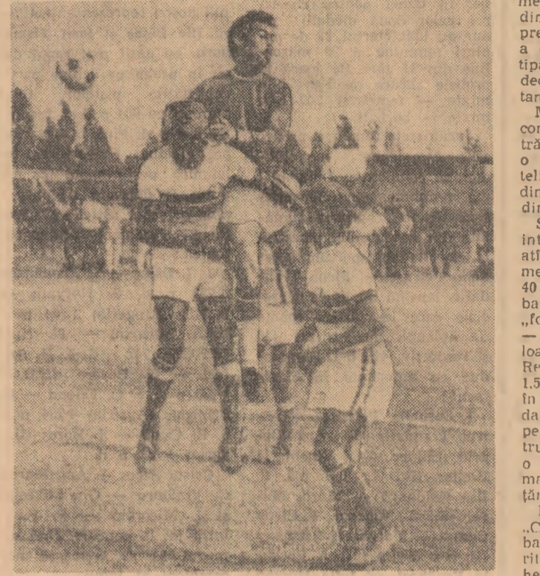
Fază dintr-un meci de antrenament susținut la Leon de echipa Marocului

Federația română de fotbal a stabilit ca toate meciurile din campionatele diviziilor B și C care vor avea loc duminică, 31 mai, să înceapă la ora 17.30.