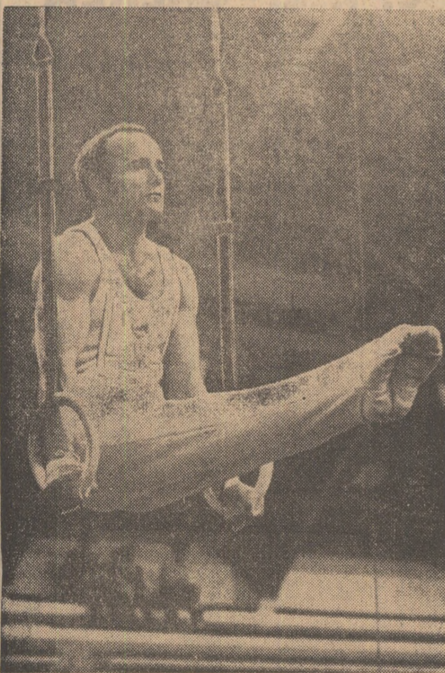
L. Buh, la inele