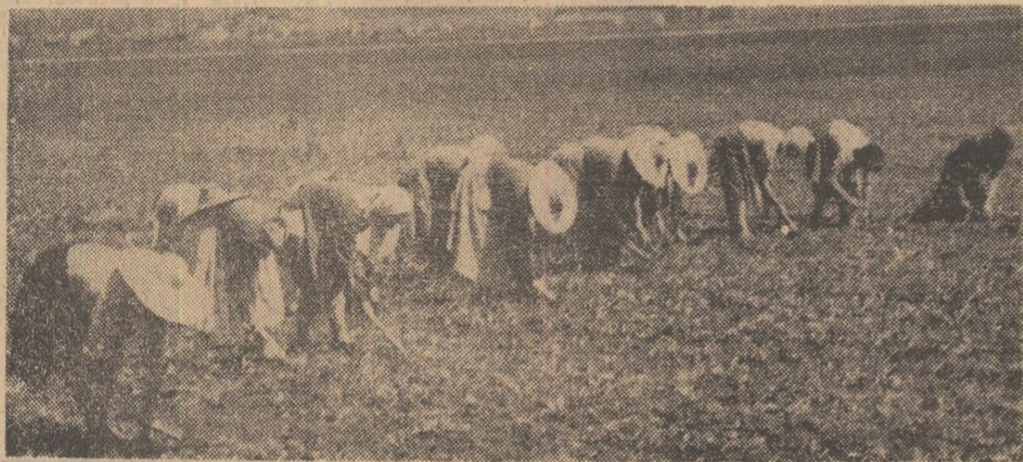
Semințe noi în pământul smuls apelor. Bătălia recoltei trebuie câștigată!