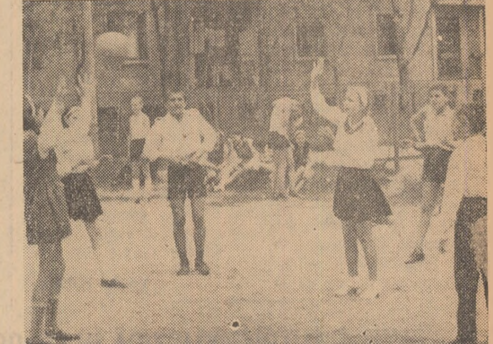
Mingea — o permanentă atracție și pentru copiii din cartierul Ferentari, care își desfășoară activitatea pe terenul special amenajat între blocuri.

O întrebare, căreia la prima vedere nu am fi tentați să-i acordăm importanța cuvenită: ce este joaca, ce rol are ea? În primul rînd, ea constituie forma fundamentală de activitate a copilului, prelungită alături de cea școlară pînă în perioada adolescenței. Importanța prin perspectivele pe care le deschide