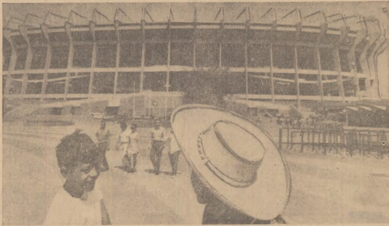
Marele stadion Azteca din Ciudad de Mexico și-a deschis ieri porțile. În imagine, un aspect al exteriorului stadionului, cu cîteva ore înainte de solemnitatea de inaugurare a celei de a 9-a ediții a campionatului mondial.

La terminarea festivității, celor trei personalități care au coborît pe terenul de joc, le-au fost prezentați antrenorii, jucătorii și arbitrii partidei de debut.