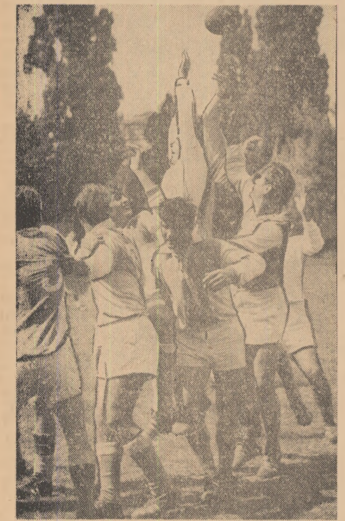
O dispută dîrză pentru balon între jucătorii formațiilor Rapid și Cimentul Medgidia.