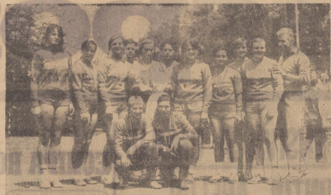
Handbalistele de la Universitatea Timișoara zîmbesc fericite în fața obiectivului după ce au reușit să-și mențină titlul de campioane ale țării.