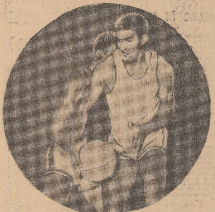
Baschetbalistul de culoare Williams, unul din artizanii victoriei lui Fides-Napoli.

Recent, Comitetul Federației române de scrimă a luat în discuție rezultatele obținute în activitatea de performanță, precum și stadiul de pregătire a loturilor reprezentative, acum, la jumătatea drumului care a mai rămas pînă la J. O.