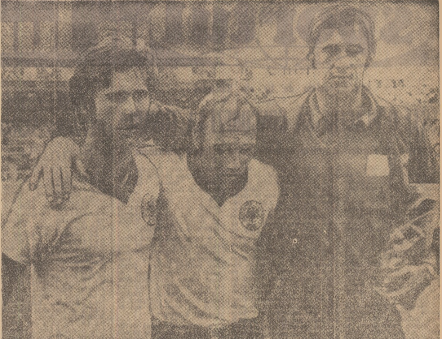
Ah, ce greu a fost! Uwe Seeler — încadrat de Gerd Müller (stînga) și Max Lorenz — epuizat de efort, după meciul cu Maroc (R.F.G. — Maroc 2-1)