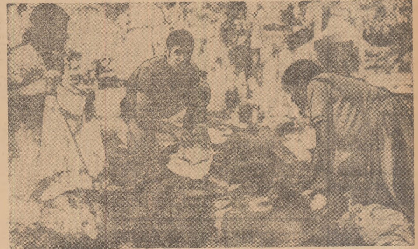
Fotbaliștii asistă la spălarea rufelor în chip tradițional mexican

— cum spunem — anumită — cu trei zile înainte de deschiderea Congresului F.I.F.A. Marți seara, reprezentanții presei au fost anunțați că dl. Teodilo Salinas, președintele CONMEBOL (Confederația sud-americană de fotbal) a avut o convorbire cu dl. Guillermo Canedo, președintele federației mexicane și al comitetului de organizare, în cadrul căreia a făcut cunoscut faptul că această puternică organizație nu este de acord cu propunerea europeană, considerând-o contrară intereselor federațiilor sud-americane. Atitudinea de rău augur a produs o reacție violentă din partea ziariștilor europeni — care au etichetat pe conducătorul CONMEBOL-ului drept un «avocat al violenței», amintindu-se în acest sens cele petrecute la jocul Estudiantes — A.C. Milan.