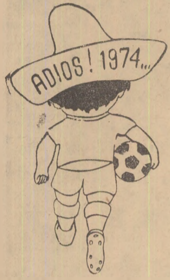
Desen de AL. LISKA

Înfinirea finală a celei de a IX-a ediții a Campionatului mondial de fotbal a reunit în tribunele stadionului „Azteca” din Ciudad de Mexico 110.000 de spectatori care au aplaudat după 90 de minute victoria pe deplin meritată a selecției braziliene, excelentă în jocul la mijlocul terenului și cu o linie de atac în vervă.