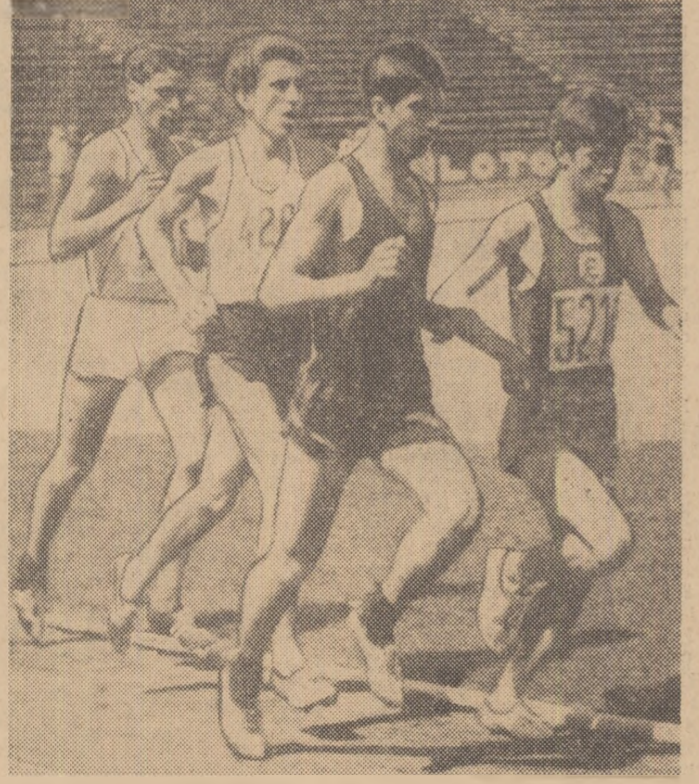
Luptă strînsă în proba de 3.000 m plat.