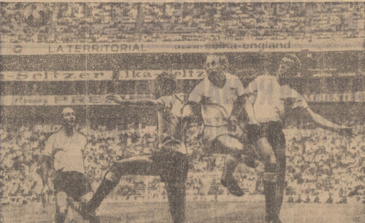
Uwe Seeler — flancat de trei adversari: Ubina, Anчета și Motosas — reușește totuși să reia cu capul centrarea lui Libuda.