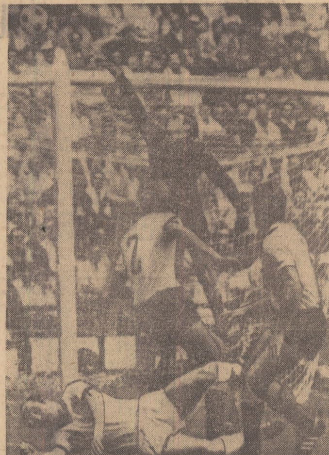
Uwe Seeler — la pămînt — după o șarjă la poarta Uruguayului. Fază din meciul R. F. a Germaniei — Uruguay