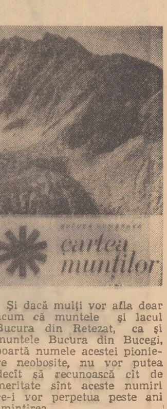
Si daca multi vor afla doar acum ca muntele și lacul Bucura din Retezat...

fiilor naturii, a mirajului muntilor, cartea aceasta e sortita unei celebritati de antologie.