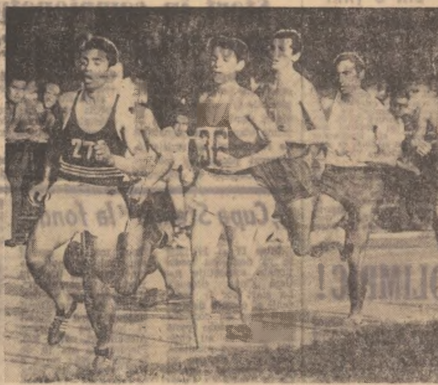
Aspect din prima serie a cursei de 800 m plat