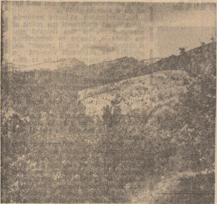
In munții Baiului