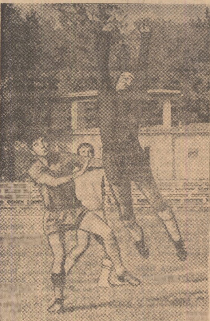
Pe stadionul Politehnica, s-au întâlnit Sportul studențesc și Metalul. Iată o fază din acest meci, în care atacul la poartă studențesc este... stopat de portar.