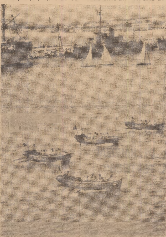
Aspect de la una din numeroasele probe sportive cuprinse în spectacolul oferit de marinarii militari.

drumul către avanport și fericită în care masele își manifestă deschis și sincer adunarea lor la politica partidului și statului, voința ne-strămutată a tuturor categoriilor de cetățeni ai patriei indiferent de naționalitate, de a urma neabătut linia tra-