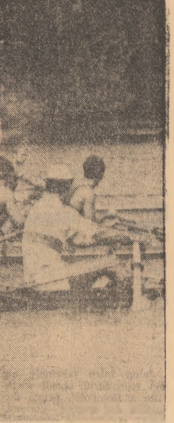
Spectaculoasa cursă de 2 vîsle la punctul care marchează 500 m.

Prin Tarasov, Moldoveanu, Ivanov și Tusa, adică prin schif de 4 f.c., vom câștiga la treia medalie de aur u regatei. A fost o cursă strînsă (echipajul S.C. Dinamo Berlin s-a aflat în permanență la o secundă în urma învîgătorilor), frumoasă, de ridicată valoare tehnică (pe locul trei, sportivii cehoslovaci, tot cu o secundă avans față de adversari — schifștii de la Armia Kiev).