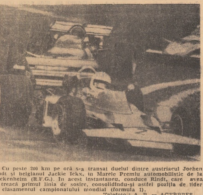
Cu peste 200 km pe oră s-a trasat duetul dintre austriacul Jochen Hindt și belgianul Jackie Ickx, în Marele Premiu la automobilism de la Hockenheim (R.F.G.). În acest instantaneu, conduce Hindt, care avea să treacă primul linia de sosire, consolidîndu-și astfel poziția de lider în clasamentul campionatului mondial (formula 1).