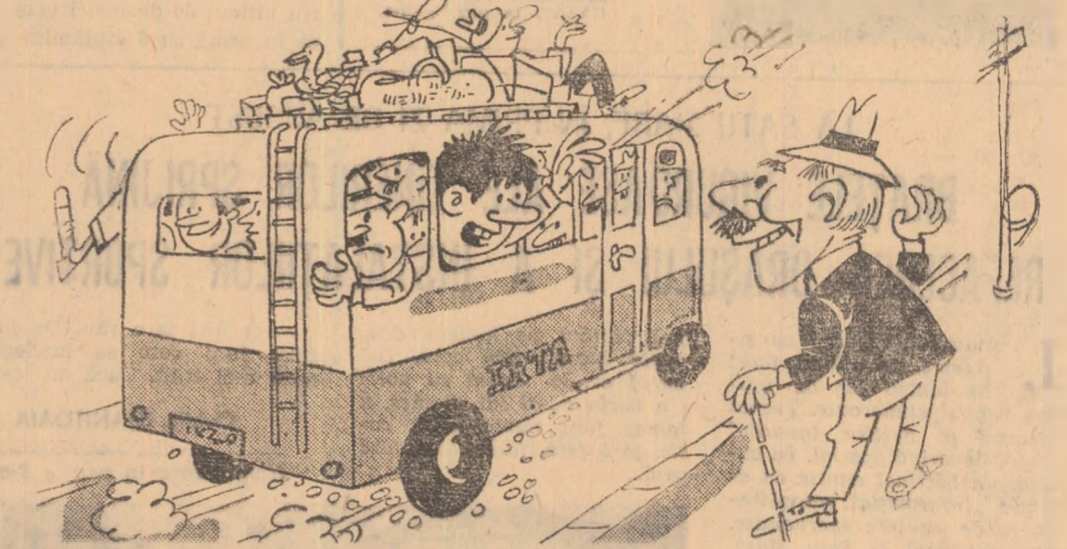
— Nici o grijă, tată, mă întorc sigur, la noaptea! — Poate pe partea... aialtă!

În anul 1969, o delegație a Consiliului Național pentru Educație Fizică și Sport din România a făcut o vizită în Uniunea Sovietică, la invitația Comitetului pentru Cultură Fizică și Sport de pe lîngă Consiliul de Miniștri al U.R.S.S. Cu acest prilej au avut loc convorbiri, desfășurate într-un