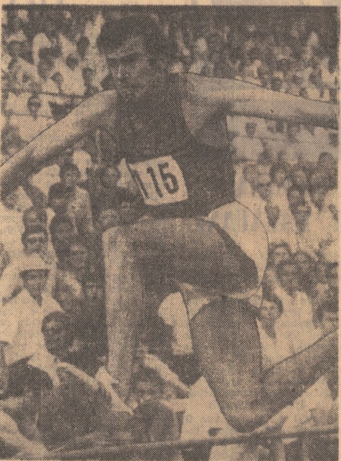
Viktor Saneev, 17,35 m la triplusalt, marile performanțelor al semifinalei masculine de la Zürich

În încheierea acestor păreri adăugăm și pe aceea a unui spectator anonim, care a așteptat pînă în ultimul mo- ment să afle rezultatele pro- belor surprinse de întineric: „Ar trebui să serieți că la un concurs ca acesta este necesar să se acorde mai mare a- tenție informării spectatorilor. Crainicul ne-a spus de regulă ce trebuia să urmărim, nu ceea ce urma... La ultimele probe a dat numai rezultatele primelor trei clasate. Or, ne interesau și celelalte”. Și, fi- nindă spectatorul avea dreptate, am reținut opinia sa, pe care o supunem atenției or- ganizatorilor.