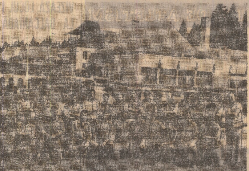
La Brașov, oaspeții „Steagului roșu”, fotbaliiștii echipei Olympiakos Pireu