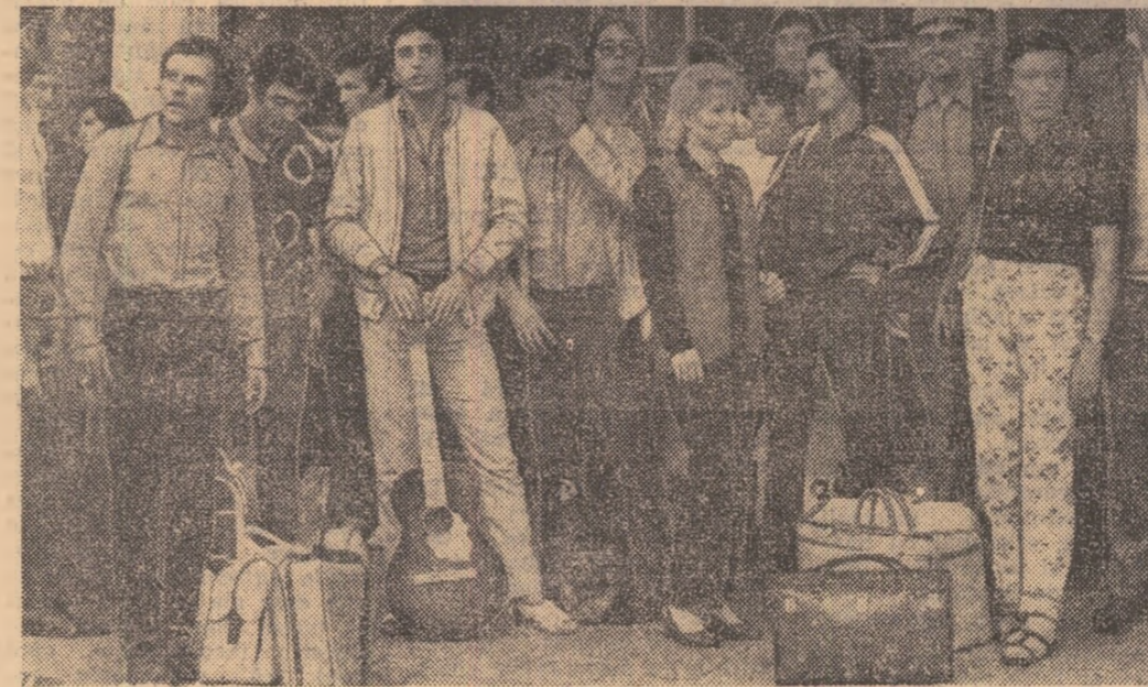
O parte a echipei iugoslave în Gara de Nord.

La ora 13,30 am luat drumul Otopeniului în așteptarea „charterului” care trebuia să aducă, de la Atena,