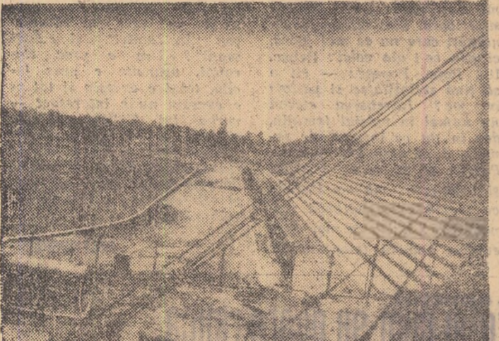
In curând, noul stadion din Brăila va cunoaște animația întrecerilor sportive

În aceste zile de august fierbinte, în care întregul popor, animat de istoricele hotărâri ale Congresului al X-lea al P.C.R., muncește cu hâncărie pentru a cinsti marea sărbătoare a patriei române, și AUGUST, SPORTUL VII PROGRESULUI BRĂILEAN ÎNCHEIE PRIMA ETAPĂ DE FAURIRE A MODERNULUI JOC COMPLEX, O BUNĂ PARTE DIN ORELE DE MUNCĂ PRESENTATE ACI APARTINÎNDU-LE.