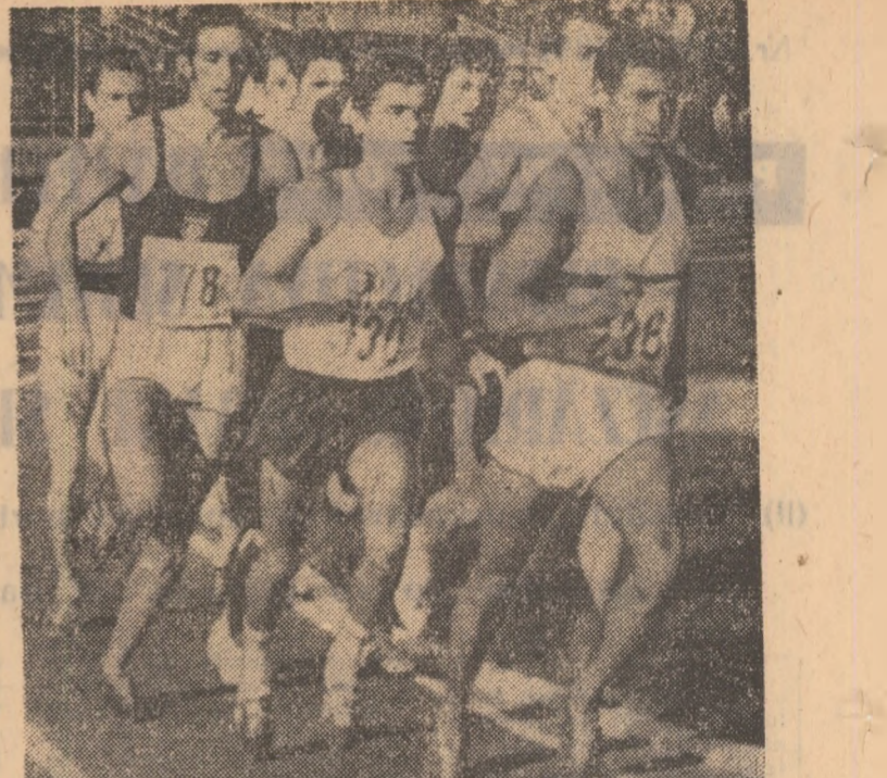
Alergătorul turc Tımkan conduce plutonul compact în proba de 1500 m. Cîștigătorul, Joze Medjimurec se află undeva în spate.

rească și cel de al doilea titlu balcanic la această ediție! Păcat că n-a reușit. Cu toate acestea, spectatoriul cu toate și pînă la ultimul metru al finalei probei de 200 m, Ivanka Venkova a rezistat mai bine acestui debordant sprint prelungit și a cîștigat de justete o cursă memorabilă.