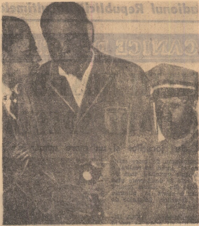
Un caz ies trei barbati. Doi sanitari. Intre ei, fostul campion mondial de box Joe Louis. Are in mana aceeași valiză cu care mergea, pe vremuri, spre sălile de box. Acum, este dus în altă parte...