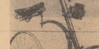
Un velociped de acum trei sferturi de veac!