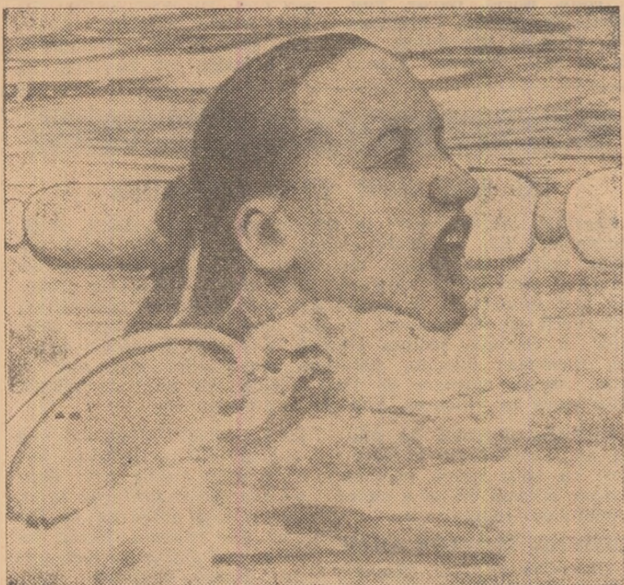
Înotătoarea sovietică Alla Grebenikova în timpul cursei în care a stabilit un nou record al Universiadei în proba de 200 m bras.

În sunet prelung de trompeți, pe pistă își face apariția un student purtând stindardul F.I.S.U. În urma sa, trei ti-