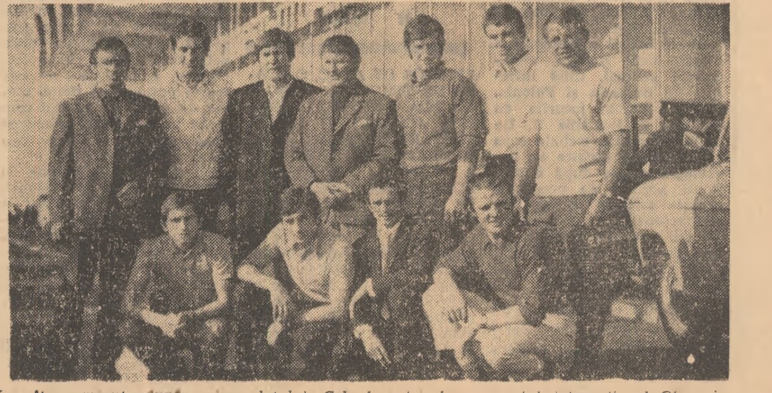
La câteva minute după sosirea lotului Cehoslovaciei la aeroportul internațional Otopeni