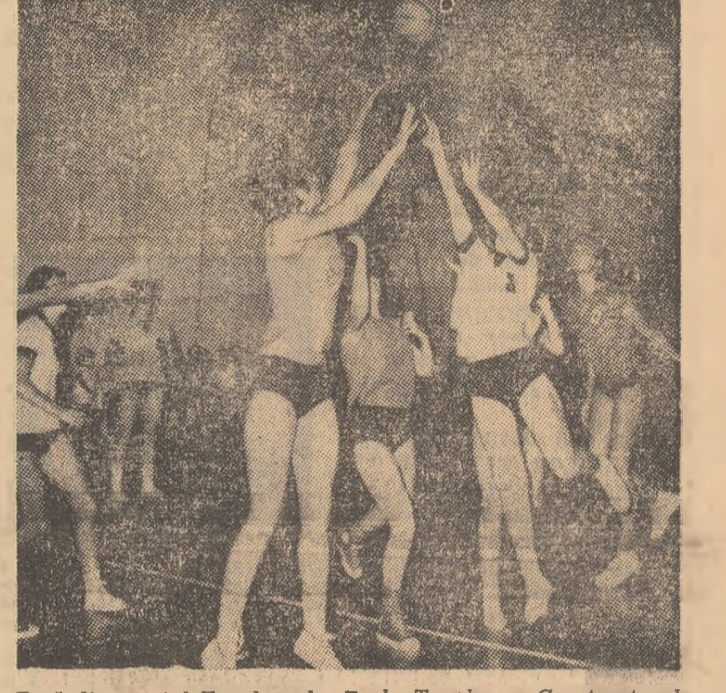
Fază din meciul Topolceanka Backa Topola — Constructorul București

La început, surpriză neplăcută în sala Giulești, în etapa inaugurală a competiției feminine de baschet „Cupa Rapid” — Doararea Progresul a înțeles în ultimul moment că nu mai poate participa la întreceri, locul acestei echipe a fost luat de tînră formație a Școlii sportive nr. 2. Pînă la urmă, schimbarea s-a dovedit fericită, deoarece elevule antrenorului C. Dimescu au dat o replică neașteptat de dîrză echipei Rapid, al cărui antrenor, S. Ferencz, a folosit atît jucătoare experimentate cit și cîteva junioare, produse ale peninsierei proprii. Victoria a revenit ferovierelor cu 71-43