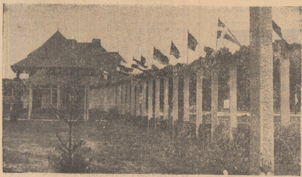
Poligonul Tunari gata pentru o nouă sărbătoare

În 15 ani, pădurea din pădurea Tunarilor s-a familiarizat cu zgomotul focurilor de armă, nu se mai sperie, au învățat din mamă în pui că oamenii aceștia cu frunți îngândurate, pășind grav și măsurat, nu vor să le facă nici un rău, vinând doar jinte nemșoșate sau farfurii de hâmb neagră, cu zborurile lor capricioase, neașteptate.